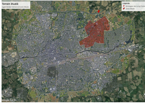
Figure 1. Terrain étudié et agglomération rennaise (réalisation de l'auteur)

D'autres solutions sont alors envisagées, en particulier – dans le sillage des bureaux des temps qui se multiplient sur le territoire national dont Rennes, créé en 2002, fut le premier – le fait d'influer sur la demande afin d'arriver à une répartition plus homogène des déplacements dans le temps (écrêtement de la pointe). Si cette ambition n'est pas nouvelle, elle a connu ces derniers temps un regain d'intérêt certain (on peut citer l'expérimentation « Hyperpointe métro » à Rennes en 2012 ou plus récemment le « Challenge mobilité » à La Défense en 2019) mais le cadre théorique ainsi que les évaluations font souvent défaut (Boulin, 2008).