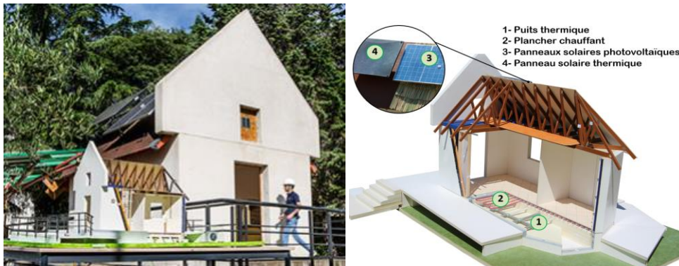
Figure 1. Le bâtiment expérimental de l'IUT de Nîmes, photo et maquette.

Les murs et le plafond sont isolés par du Métisse®, isolant biosourcé, conçu à partir de laine de coton recyclée. Le bâtiment est réalisé sur un média sable + chaux contenant un échangeur sol-air permettant la récupération des émissions basses du plancher du bâtiment. Le chauffage et le rafraîchissement s'effectuent exclusivement par le plancher.