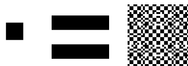
Figures 2, 3, 4. Exemple d'images fixes créées dans Jitter

L'environnement de programmation Max/Jitter est utilisé comme un générateur audiovisuel qui permet de constituer un catalogue de sons et d'images fixes ou animées.