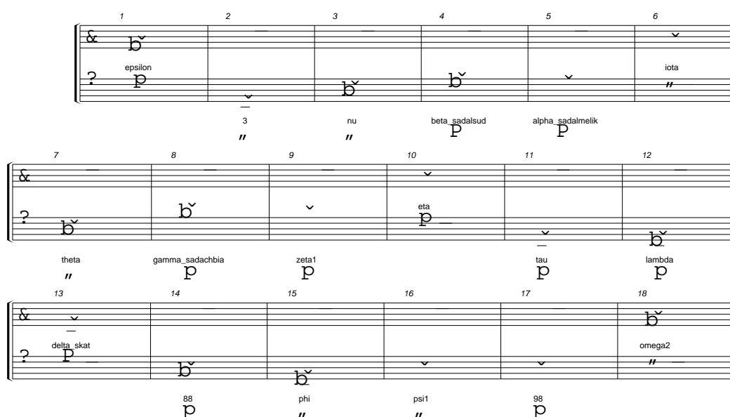
Fig. 3 Les hauteurs et les dynamiques des notes calculées pour la constellation "Aquarius".

Ainsi, l'apparition temporelle des solos correspond aux moments importants de mouvements de deux objets le plus visible dans le ciel. Par contre, le matériau pour la construction des séquences correspond aux données qui se rapportent aux objets qui se trouvent dans le ciel à ce moment donné.