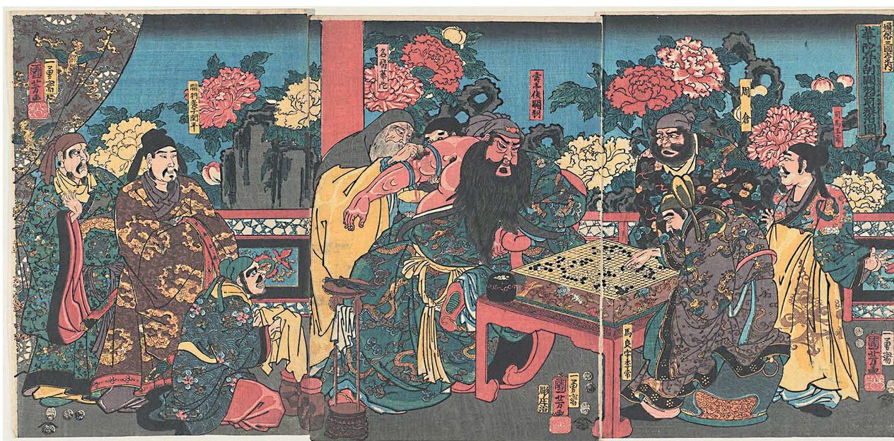
Figure 1 - Gravure sur bois de l'artiste japonais, Utagawa Kuniyoshi (1797–1861), graveur Tsuge Shōjirō, éditeur Tsutaya Kichizō (1853), représentant Hua Tuo opérant le bras de Guan Yu blessé par une flèche empoisonnée, en grattant l'os lésé, alors que le général Han impassible joue avec un autre général selon la légende du roman Les Trois Royaumes (XIV e siècle, San Guo Yan Yi ) de Luo Guan-zhong (36,2 cm x 75,3 cm, Museum of fine arts Boston).

Pour les historiens des transferts culturels entre l'Inde et la Chine (1), ces rapprochements démontrent plutôt la précocité de ces transferts qui doivent être relativisés, c'est-à-dire non pas vus comme de simples copies, mais qui sont aussi une manière de constituer une identité chinoise réelle, comme cela est le cas pour les récits de la vie de Hua Tuo. Les éléments de récits anciens semblent alors être employés à double sens comme des outils de description de figures médicales chinoises originales, présentant certes des affinités avec des figures indiennes anciennes, mais authentiquement chinoises, par une hybridation culturelle complexe, tout en construisant un second sens selon lequel ces figures chinoises s'inscriraient dans une tradition bouddhiste en continuité avec la tradition indienne, selon une stratégie chinoise de justification du bouddhisme.