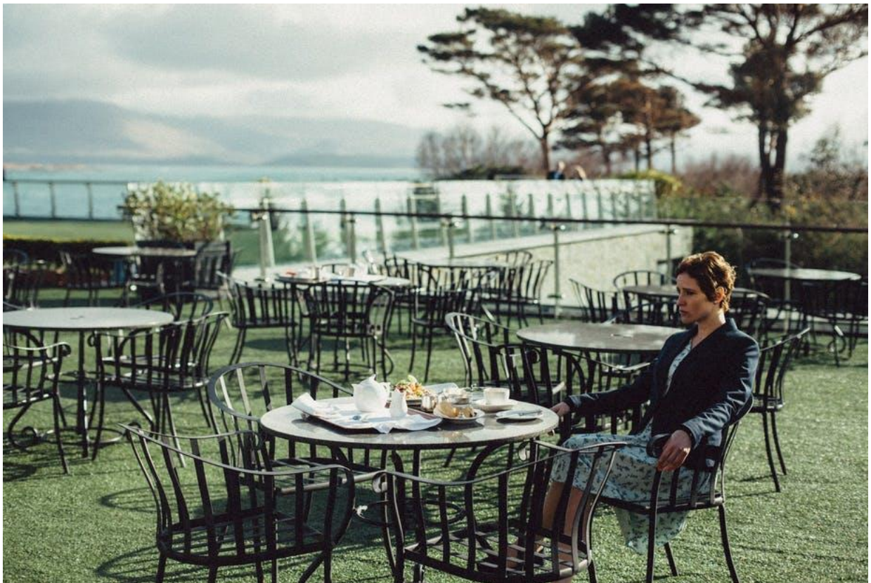
The Lobster

The Conversation , disponible en ligne : https://theconversation.com/vivre-celibataire-aujourd'hui-loin-des-idees-recues-152261