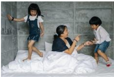
Une femme et ses enfants.

De premier abord surprenant, ce résultat s'éclaire à l'aune des témoignages des femmes employées et ouvrières interviewées. D'abord lorsqu'elles soulignent la continuité de leur rôle et de leur travail, domestique et éducatif : avec ou sans conjoint, il leur faut « tout faire », « tout gérer ». Ensuite lorsqu'elles pointent l'autonomie de décision trouvée ou retrouvée dans la vie hors couple : seules, elles sont désormais libres de décider, certes sous contraintes mais sans comptes à rendre, des dépenses ou de l'éducation des enfants. La gestion de l'argent est emblématique de cette autonomie nouvelle.