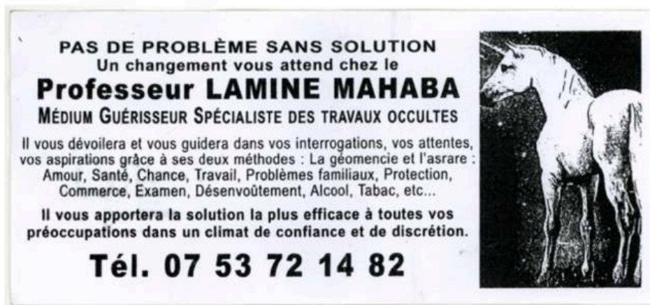
Figure 6 : Exemple de flyer d'un marabout se disant versé dans la géomancie et dans l'asrare