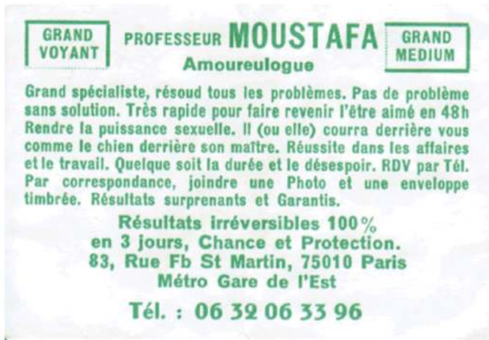
Figure 8 : Exemple de flyer d'un marabout « amoureuxlogue »