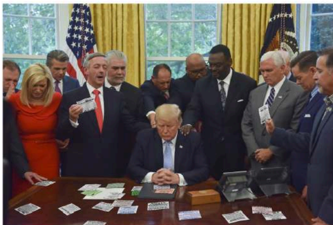
Figure 9 : Exemple de montage photographique : les marabouts à la Maison Blanche

Le document photographique exceptionnel que vous voyez ci-dessus a été "fuité" par un proche collaborateur de Trump, en 2017, au péril de sa vie. Que s'est-il passé ce jour-là, dans les premiers mois de l'administration Trump ? En faisant le point sur sa collection, le Président s'aperçoit qu'un flyer rare de M. DAFPE manque à l'appel. Branle bas de combat immédiat dans le bureau ovale ! Tous les conseillers et secrétaires d'état sont immédiatement mis à contribution pour partir à la recherche du précieux exemplaire perdu. L'ambiance est extrêmement tendue. Trump est hors de lui et déverse sa fureur sur son entourage terrorisé - chacun est un coupable potentiel ! Après plusieurs heures de recherches infructueuses, il faut se rendre à l'évidence : aucune trace de M. DAFPE. Trump craque et se met à pleurer à chaudes larmes. Il faudra toute la patience et la gentillesse du staff pour le consoler, certains allant jusqu'à offrir comme consolation de nouveaux flyers fraîchement collectés. Évidemment, la tristesse et la compassion qui se lisent sur les visages sont un peu forcées, mais que ne ferait-on pas pour témoigner son empathie au grand chef ?