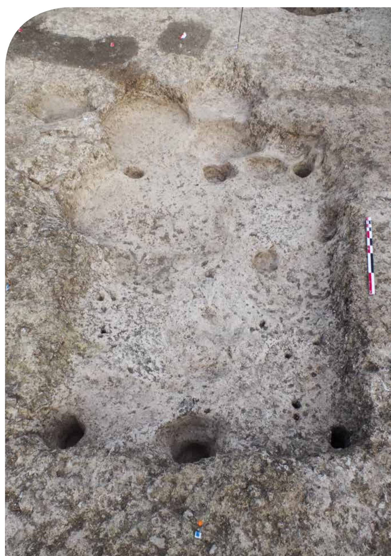
Différents types de bâtiments à sol excavé. Le site présente une grande diversité dans la disposition des trous de poteaux, et donc des élévations restituables.

La présence de fours pourrait, elle aussi, indiquer la volonté de mise en commun de certaines activités. Ces derniers sont le plus souvent composés d'une sole, d'une fosse et d'un passage les reliant. Ce dispositif implique une cuisson longue avec maintien de la chaleur, ce qui semble superflu pour le seul usage alimentaire. La majorité de ces fours sont des aménagements individuels, il en existe toutefois quelques cas où une seule fosse est flanquée de plusieurs soles.