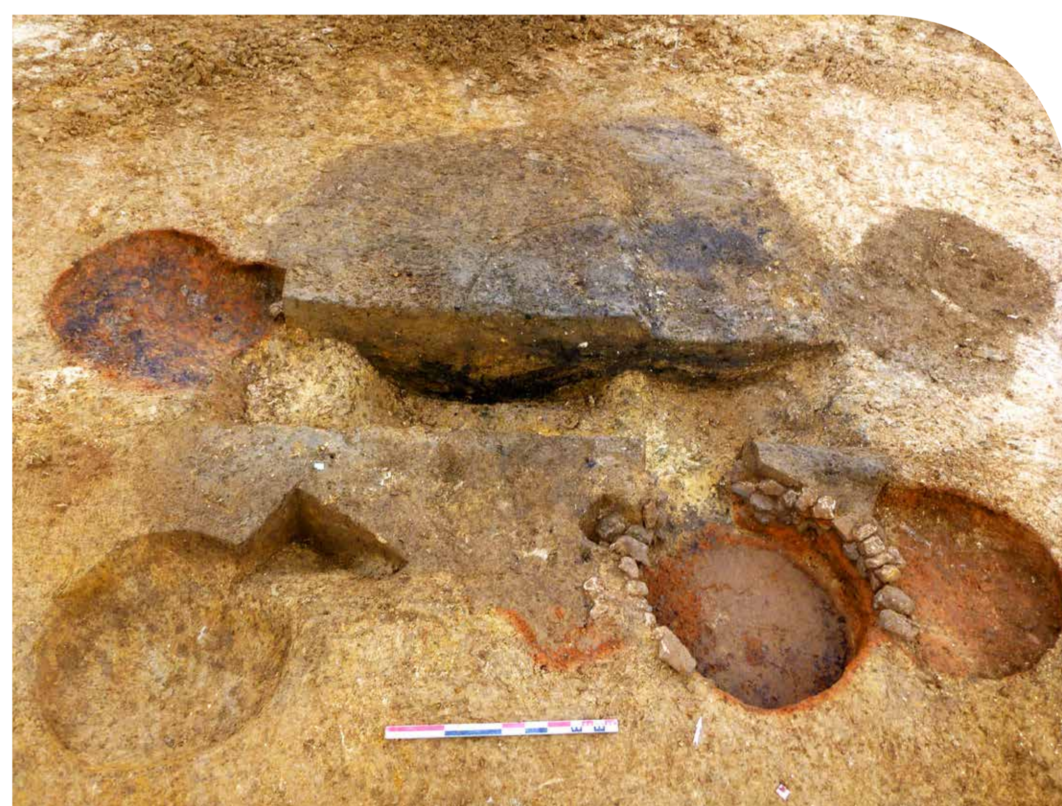
Ensemble de fours réutilisant une même fosse atelier