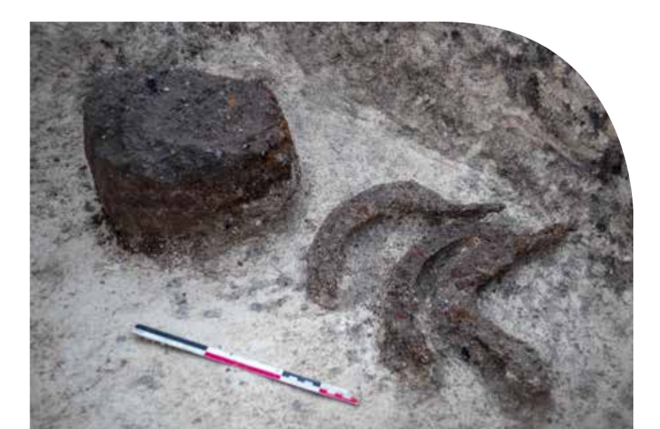
Dépôt d'outils agricoles accompagnant une incinération