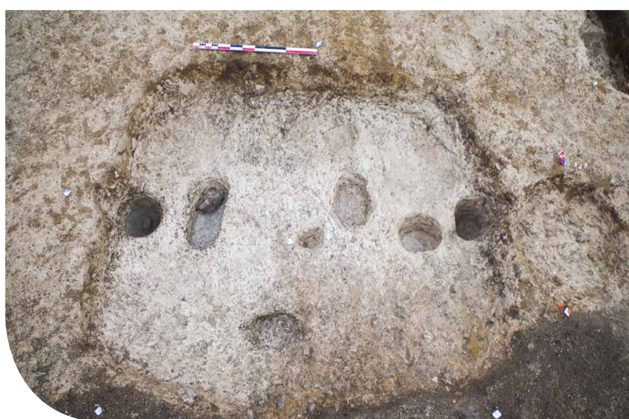
Radier de four avec tuiles romaines en remploi

La proximité avec le Sausset a indéniablement joué un rôle prédominant dans l'implantation des hommes à cet endroit. Par ailleurs, l'étude géomorphologique a permis de déterminer que jusqu'à l'époque moderne il s'agissait plutôt d'une large vallée humide que d'un cours d'eau, comme c'est le cas aujourd'hui. Les autres gisements repérés aux abords du Sausset sont plutôt nombreux et certains de ces établissements semblent avoir été occupés sur le long terme, ou à défaut, avoir été actifs au cours de plusieurs périodes chronologiques. Vers l'an mil cependant, le ru semble avoir été délaissé au profit de deux nouveaux pôles d'intérêt qui aboutiront à la création des villages de Tremblay-en-France et de Villepinte. Les fouilles du Chemin des Ruisseaux , outre leur intérêt sur le témoignage de la formation et le développement d'un lieu, permettent ainsi d'alimenter une problématique plus générale sur la structuration du paysage, notamment à l'époque médiévale.