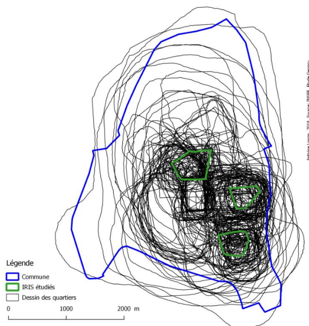
Figure 1. Limites des quartiers perçus dessinées par les 225 personnes interrogées dans les quartiers d'étude de la ville de Créteil (Val-de-Marne)