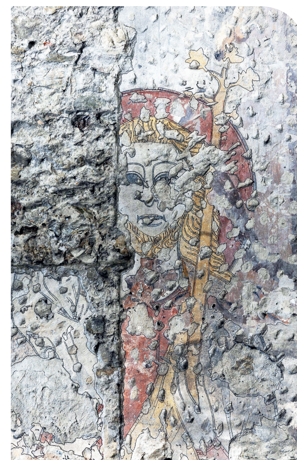
Fig. 2 Saint Christophe, photographie de la peinture murale du chevet coté nord avec superposition du relevé effectué à l'échelle 1 (le personnage fait 150 cm par 108 cm) ; photographie & DAO : Camille COLLOMB

L'opération n'a pas fondamentalement remis en question les acquis des études antérieures. L'église Saint-Georges conserve dans son mur gouttereau sud les témoignages de trois états successifs :