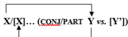
Schéma 3 : H en emploi mixte, conjonction et particule

Nous représenterons ces emplois mixtes où X et Y apparaissent étroitement soudés, chacun déterminant les conditions d'interprétation de l'autre, par le schéma suivant, qui combine les propriétés de la conjonction et de la particule :