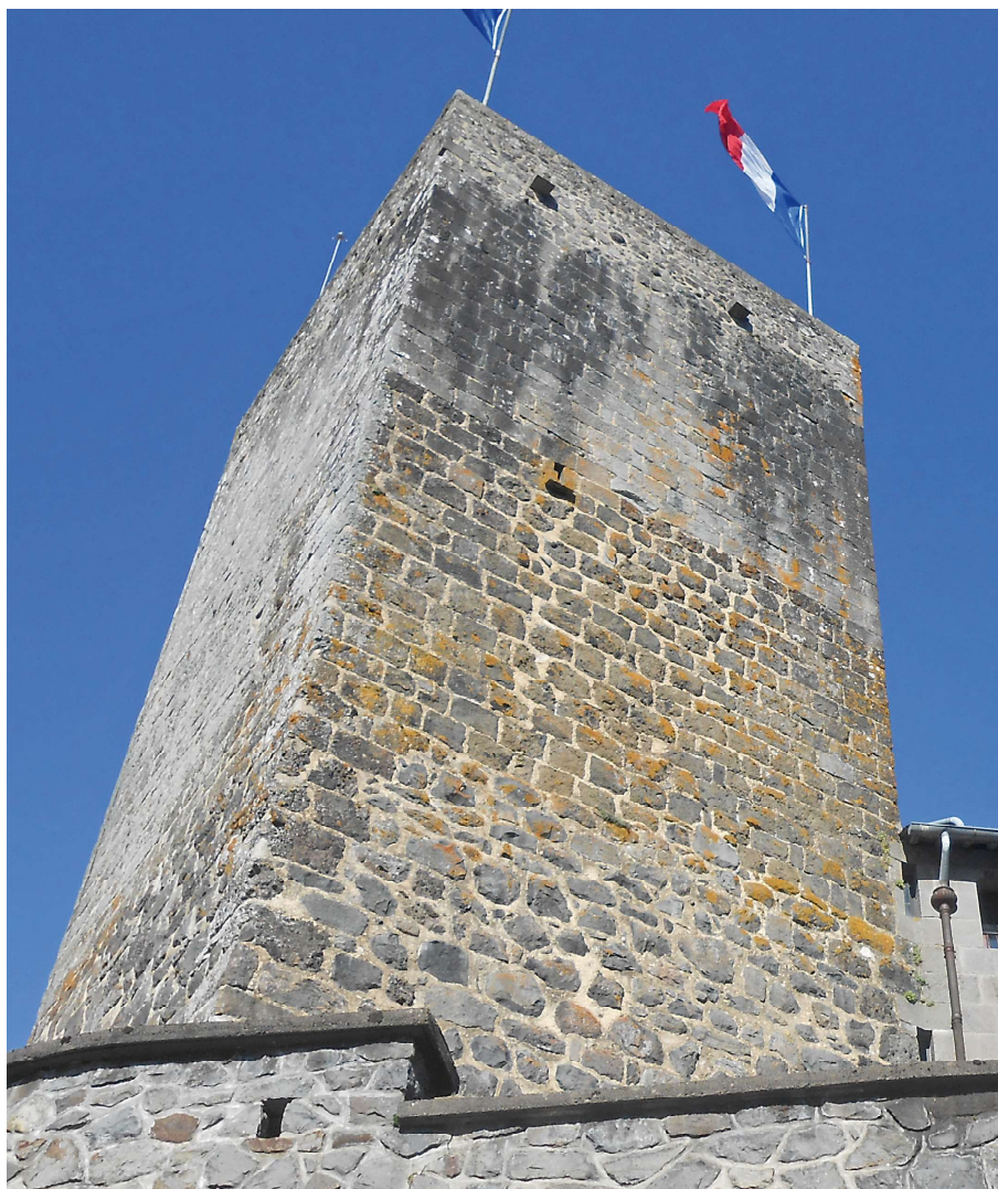
Fig. 2 : Donjon du château Saint-Étienne (Aurillac) : les différents niveaux d'élévations font usage de pierres de tailles à dimensions « standardisées ». Les cairons ne servent pas uniquement aux constructions religieuses et sont adoptés pour les demeures laïques et seigneuriales dès le XII e siècle

ruines de l'abbaye 32 . Ce toponyme fait référence à une utilisation de ces cairons , ces pierres de taille (Fig. 2.).