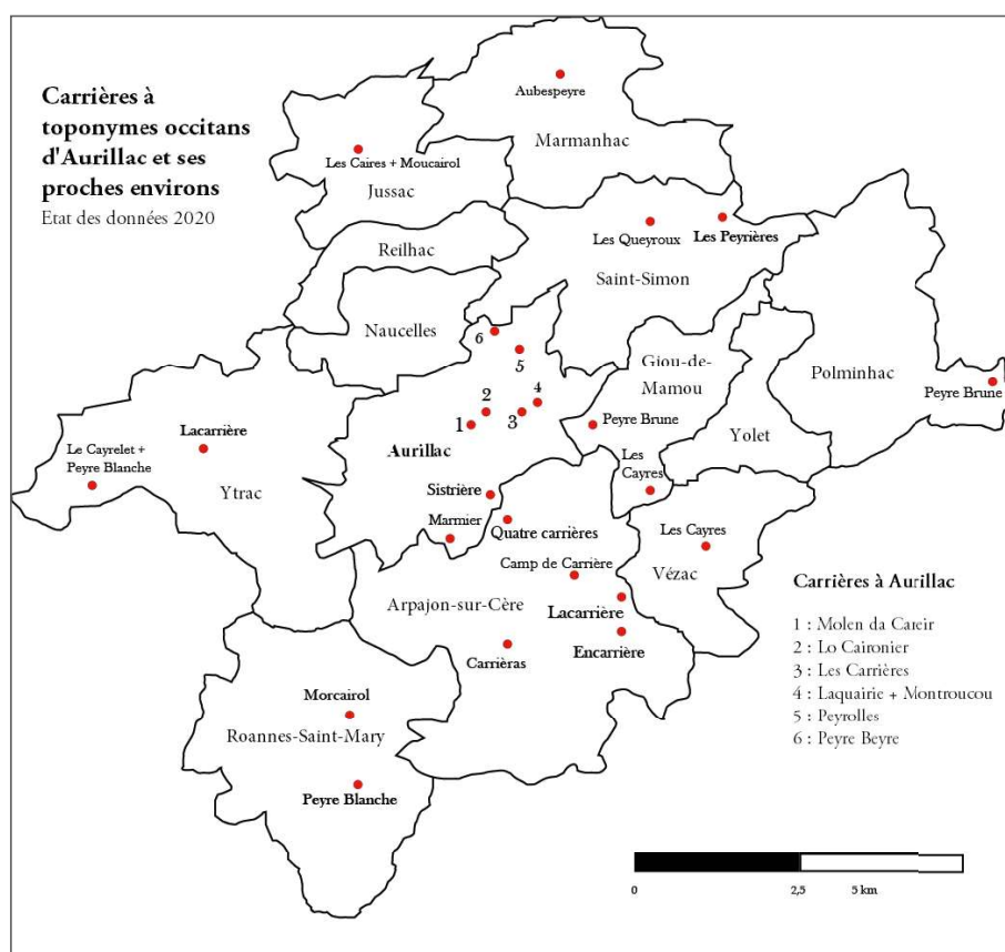
Fig. 3 : Carte des carrières à noms occitans d'Aurillac et de ses proches environs