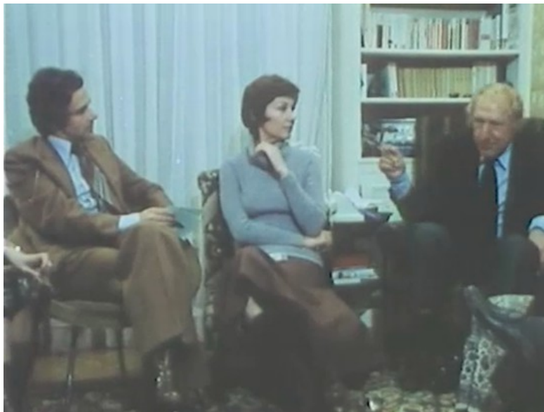
Visuel 3. Sur les traces de Balint / 37'.15"