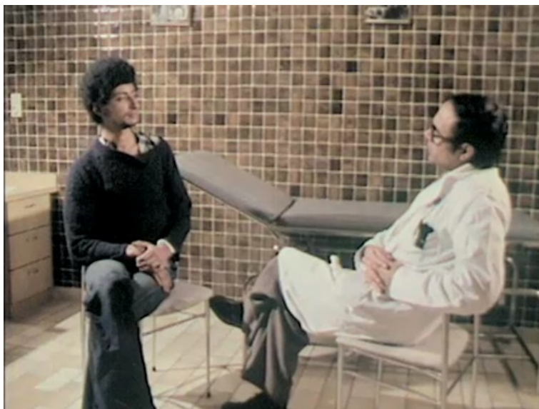
Visuel 4. Les pièges de l'urgence / 10'.07" Les Urgences psychiatriques de l'Hôtel Dieu, Paris Film réalisé par Éric Duviivier

Des plans récurrents dans Sur les traces de Balint mettent en scène le même enjeu du « tour de parole ». Parmi les médecins censés constituer un « groupe de parole », une femme cherche à intervenir, le manifeste par une gestuelle sollicitante, se ravise finalement sans qu'une parole de sa part ne se fasse finalement entendre. Le film invite à s'intéresser de cette façon à un autre type d'interactions qui concerne les médecins : l'échange entre pairs. Est-ce parce qu'elle est femme, parce qu'elle exerce depuis moins longtemps que les autres, ou parce qu'elle présente des inhibitions personnelles ? Sans chercher à l'expliquer, par exemple par des commentaires du Dr. Sapir, le film, quoiqu'en silence, désigne résolument la réalité de son autocensure. Pour Lallier, les tours de parole « encadrent les signes de la représentation sociale, ils témoignent de l'ordre de l'interaction. » Ils sont « l'occasion qui permet de tenir la scène » ( Ibid. ). Ici, la femme médecin, montrée dans un désir de parler, s'avère dans l'incapacité de « tenir la scène » dont la séance de groupe Balint tient lieu.