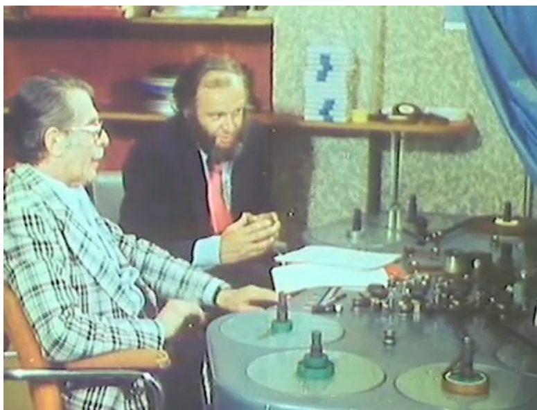
Visuel 2. Rhumatologie... / 02.14'' Film réalisé par Éric Duvivier

L'emploi de la caméra comme moyen d'observation direct débouche ici sur un montage parallèle en mise-en-abîme, visant à montrer sa pertinence comme outil critique et réflexif. Ouvrant sur une description ethnographique, le visionnage déclenche cependant des réactions d'ordre politique, où il est question d'« impuissance médicale » et d'« échec du pouvoir médical ». En quoi ces différents exemples témoignent-ils des évolutions de l'approche psychologique de la prise en charge dans les années 1970 ? Et comment peut-on interpréter cette apparente réflexivité médicale, enchâssée dans une médiation par l'institution de l'industrie pharmaceutique qui est le commanditaire des films ?