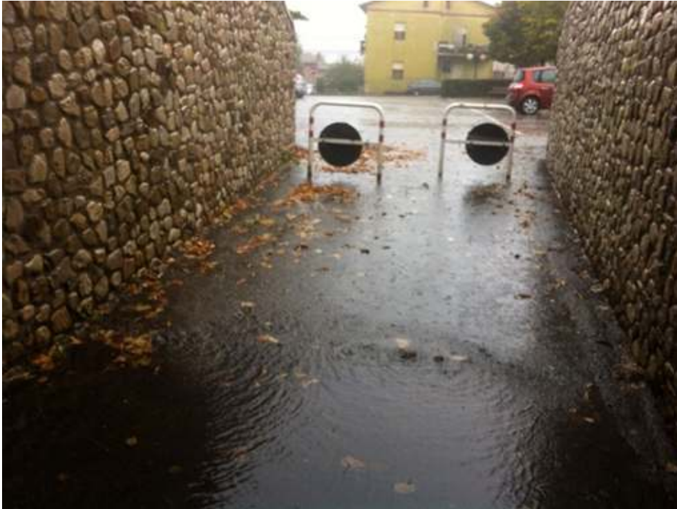
Figure 7. 1h30 sous un tunnel piéton en attendant que l'orage passe (En direction d'Orvieto, 3 novembre 2019)