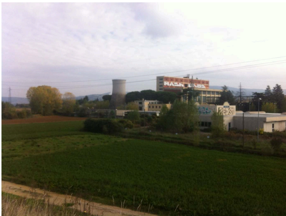
Figure 12. Traversée pesante (en direction de Pérouse, 30 octobre 2019)