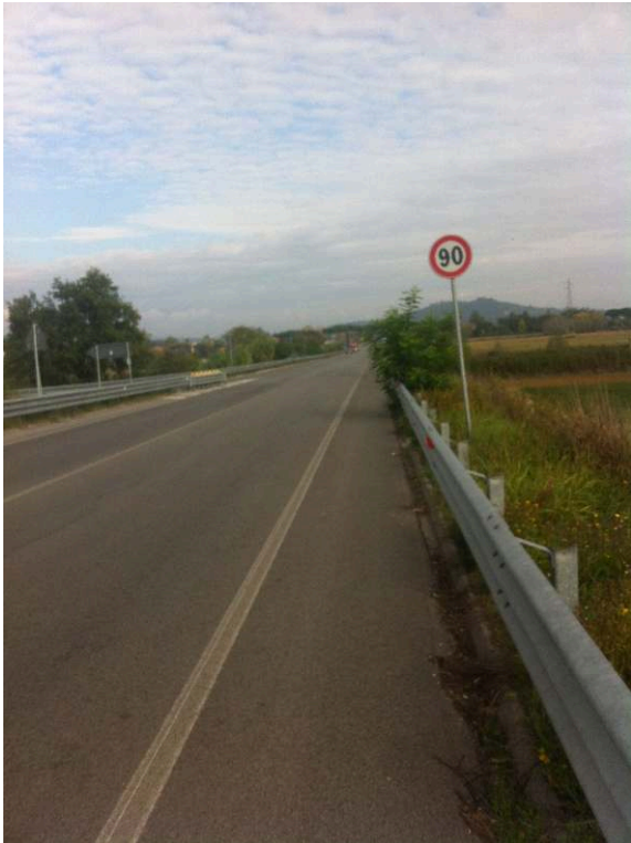
Figure 4. Circulation sur la bande d'arrêt d'urgence d'une route nationale (en direction de Pérouse, 30 octobre 2019)