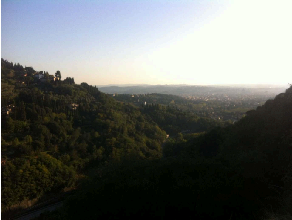
Figure 11. Contemplation (en direction de Florence, 26 octobre 2019)