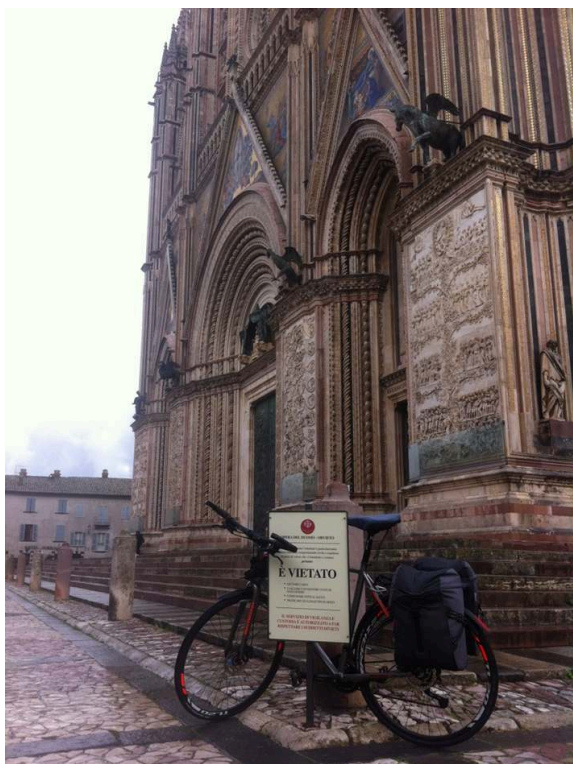
Figure 5. Stationnement sur le parvis de la cathédrale d'Orvieto (Orvieto, 30 octobre 2019)