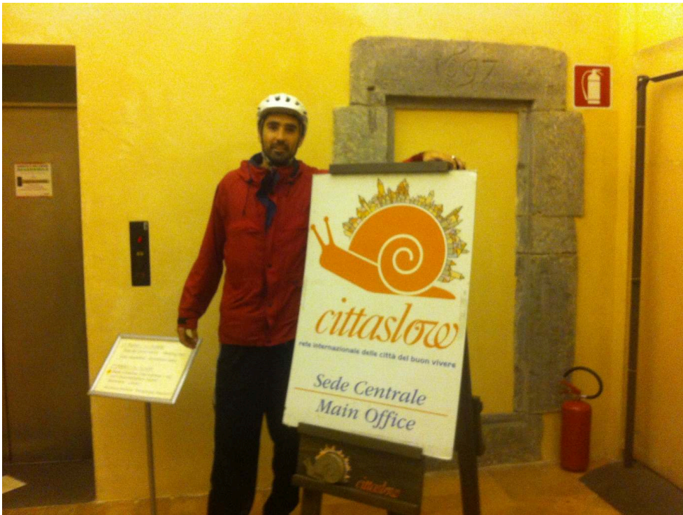
Figure 9. Arrivée à vélo au secrétariat général de l'association Cittaslow (Orvieto, 3 novembre 2019)