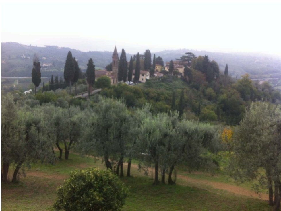
Figure 13. Traversée légère (en direction de Castelnuovo Berardenga, 28 octobre 2019)