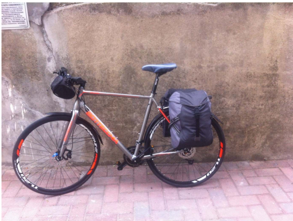
Figure 2. Mon vélo Bottechia (Bologne, 22 octobre 2019)