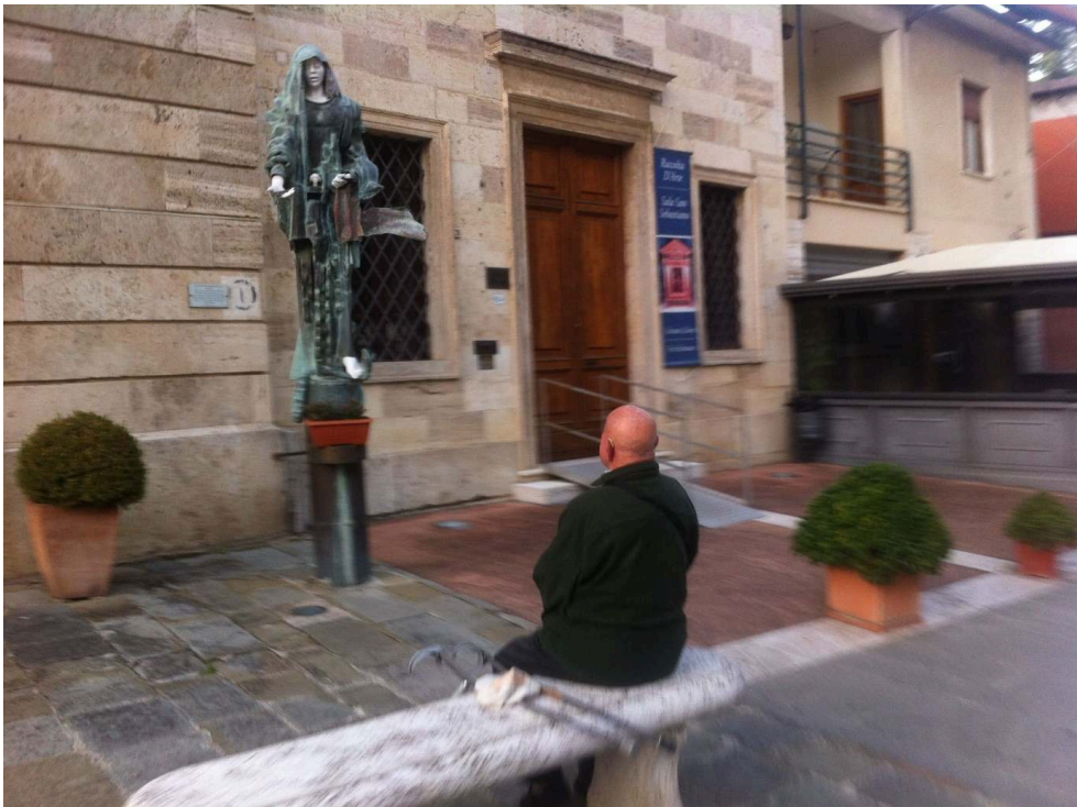
Figure 10. Temps suspendu (Castelnuovo Berardenga, 28 octobre 2019)