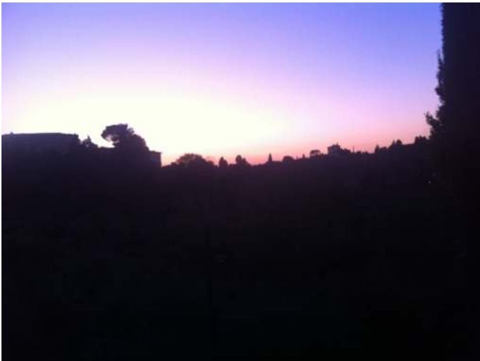
Figure 6. Je n'ai pas de lumières sur mon vélo... (En direction de Pratolino, 25 octobre 2019)