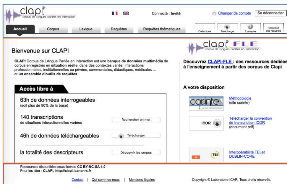
Site de la base CLAPI - page d'accueil 6 .