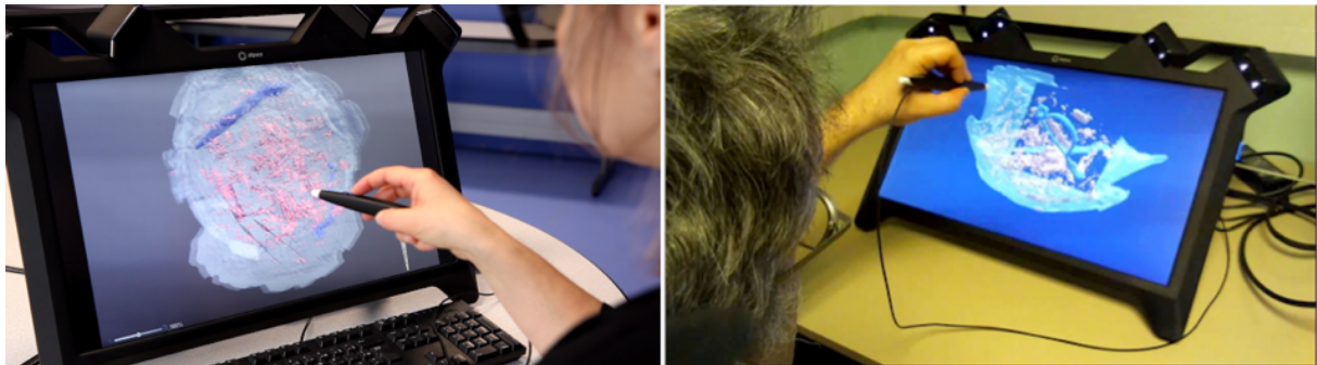
Fig. 7. Environnement de fouille virtuelle.

Nous avons créé un environnement de fouille virtuelle (Lécuyer et al. 2018) pour préparer et documenter au mieux une opération archéologique, ou revenir a posteriori sur certains éléments du matériel original numérisé. Dans cet environnement virtuel, l'utilisateur peut retirer les objets de l'urne, les manipuler, les mesurer ou les annoter. Il peut également manipuler des plans de coupe afin d'en visualiser la structure interne. L'implémentation de l'application a été réalisée sur un environnement de type Workbench (fig. 7), le plus adapté à la petite dimension du matériel étudié.