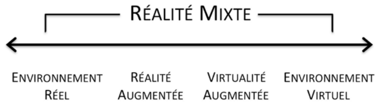
Fig. 2. Continuum de Milgram. © Milgram & Kishino 1994.