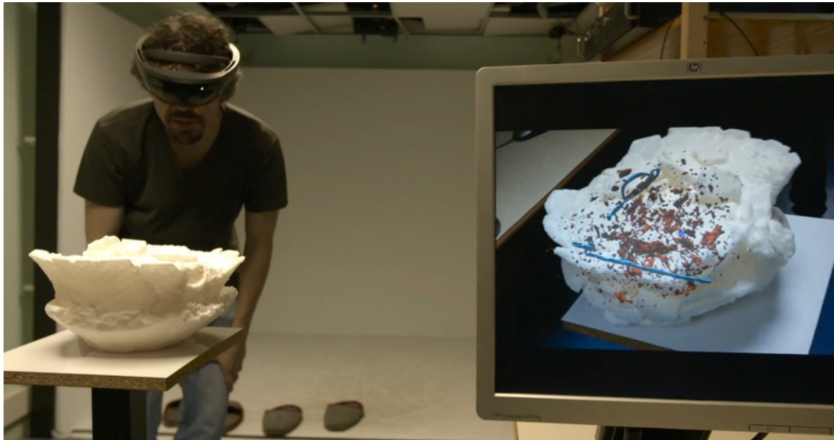
Fig. 6. Visualisation interne en réalité mixte.