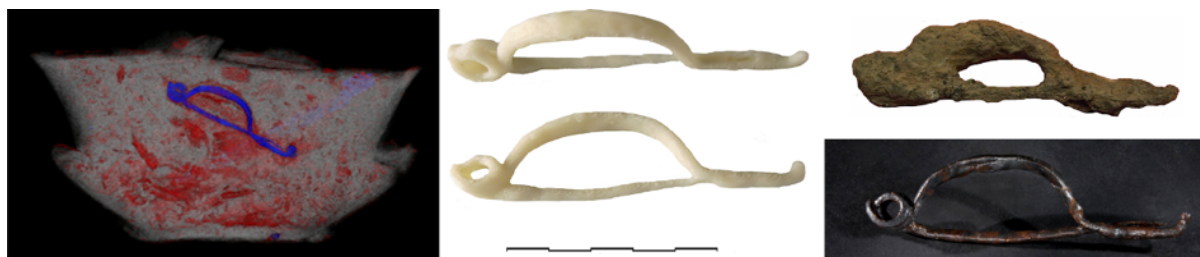
Fig. 4. À gauche, tomodensitométrie de l'urne ©Inrap/Image ET; au centre : Impression 3D de la fibule ©IRISA ; à droite : la fibule réelle avant et après restauration ©Inrap.

En parallèle, les archéologues ont décidé de fouiller l'urne afin d'en extraire la fibule et de la restaurer. La figure 4, à droite, la montre prise dans sa gangue de corrosion (en haut), puis après nettoyage (en bas). La copie obtenue, au centre, est très proche de la fibule restaurée qui, à l'observation, a révélé des marques d'ornement qui n'apparaissent ni sur la copie, ni dans les données obtenues par tomodensitométrie, car la gangue de corrosion empêchait leur détection.