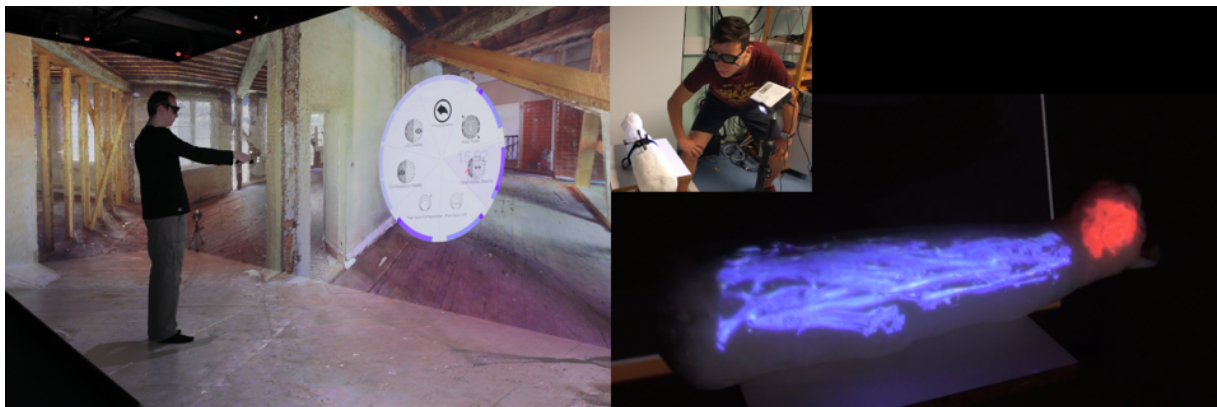
Fig. 1. Interactions en environnements de réalité virtuelle, à gauche, et de réalité augmentée, à droite.

La réalité virtuelle (RV) est un « domaine scientifique et technique exploitant l'informatique et les dispositifs d'interaction en vue de simuler, dans un environnement virtuel, le comportement d'entités 3D, qui sont en interaction en temps réel entre elles et avec un ou plusieurs utilisateurs en immersion pseudo-naturelle par l'intermédiaire de canaux sensori-moteurs » (Arnaldi et al. 2003). Dans ce domaine, des simulations numériques sont réalisées afin de représenter en 3D des univers réalistes, symboliques ou imaginaires, avec lesquels un ou plusieurs utilisateurs interagissent en utilisant leurs capacités sensorimotrices en activité réelle. Ainsi, ce n'est pas seulement l'esprit mais bien l'ensemble du corps qui est immergé dans l'univers numérique. Pour exemple, la figure 1, à gauche, présente un utilisateur en immersion dans la reconstitution d'un bâtiment, en train d'interagir avec des éléments de la scène virtuelle (Gaugne et al. 2019a).