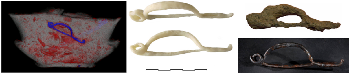
Fig. 4. À gauche, tomodensitométrie de l'urne ©Inrap/Image ET; au centre : Impression 3D de la fibule ©IRISA ; à droite : la fibule réelle avant et après restauration ©Inrap.

En parallèle, les archéologues ont décidé de fouiller l'urne afin d'en extraire la fibule et de la restaurer. La figure 4, à droite, la montre prise dans sa gangue de corrosion (en haut), puis après nettoyage (en bas). La copie obtenue, au centre, est très proche de la fibule restaurée qui, à l'observation, a révélé des marques d'ornement qui n'apparaissent ni sur la copie, ni dans les données obtenues par tomodensitométrie, car la gangue de corrosion empêchait leur détection.