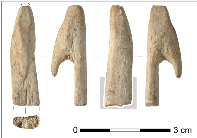
Fig. 2 : fouilles Foache en vallée d'Aspe, fragment d'objet crochu en bois de cervidé. Cadre gris : portion échantillonnée pour datation.

superposent diverses traces liées à l'histoire post-dépositionnelle de l'objet et dues pour la plupart à la circulation de l'eau : nombreuses petites cupules, desquamation, légères touches de concrétion, mouchetures noires.