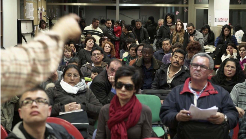
Photographie 2. Accueil des nouveaux arrivants à l'Assemblée de la PAH.