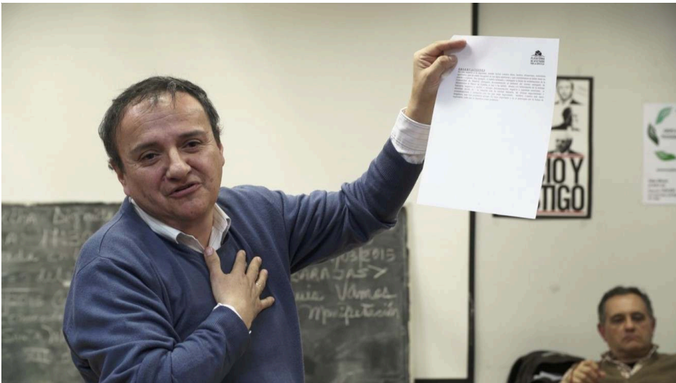
Photographie 3. Parler de soi : dans ces questionnaires, « il faut faire une photographie de nous-même ».