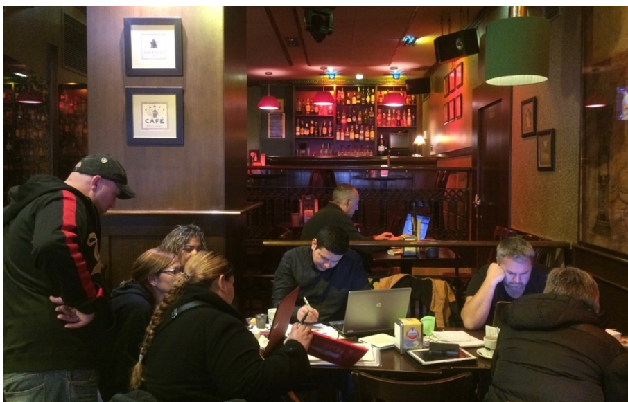
Fig. 3. L'atelier de titrisation. Huit afectados de Gijón recherchent la trace de leur dette dans les registres de la bourse de Madrid.

La seconde partie de l'atelier de titrisation, après la présentation générale, consiste à chercher sa dette sur le site de la bourse de Madrid, en suivant une série d'opérations conduisant à ouvrir les listes des fonds de titrisation qui présentent des centaines de dettes, avec leurs caractéristiques. Dans le café, on demande au gérant de baisser le volume de la télévision et les ordinateurs s'ouvrent (fig. 3 et 4).