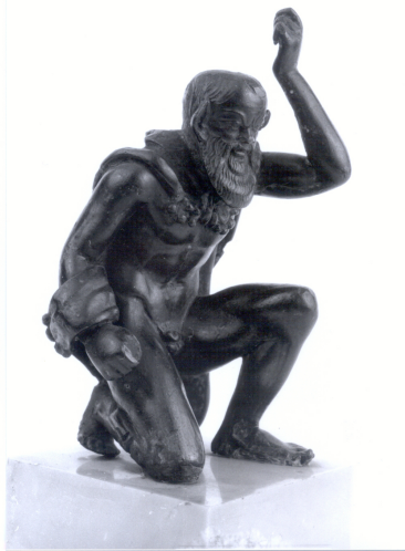
Fig. 2 : Satyre agenouillé, bronze. H. 10,6 cm, I er siècle après J.-C. BnF, Cabinet des Médailles, B.-B. 422.