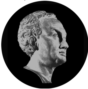
Fig. 1 : Louis-Claude Vassé, Buste du comte de Caylus . Terre cuite, H.17,9 cm, 1767, coll. privée.

Dans le cadre du programme « Histoire de l'archéologie », une collaboration s'est établie entre l'INHA et le Cabinet des Médailles de la Bibliothèque Nationale de France pour traiter de sujets intéressant les deux institutions. Grâce à cette collaboration, l'exposition « Caylus, mécène du roi (1692-1765). Collectionner les Antiquités au XVIII e siècle » a été réalisée en 2002 dans les salles du Cabinet des Médailles. Cette manifestation, premier volet d'une investigation plus ambitieuse portant sur le travail du comte de Caylus s'est poursuivie par la mise en place d'un projet de recherche intitulé : « Le comte de Caylus et l'invention de l'archéologie » qui se propose d'explorer et d'analyser les documents liés aux activités antiquaires du comte, en partant de son œuvre majeure, le Recueil d'Antiquités Égyptiennes, Étrusques, Grecques, Romaines et Gauloise , sept tomes publiés entre 1752 et 1767 (le dernier étant posthume).