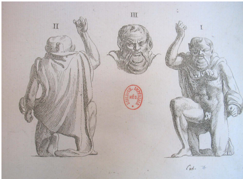
Fig. 3 : Caylus, Recueil d'Antiquités , Paris, 1867, t. VII, pl. LIV, 1-3