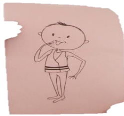
Illustration V :

Pour autant, l'institutionnalisation du groupe d'Allonne sous la forme d'une association collégiale ne va pas se faire sans rencontrer d'obstacles. D'une part, ce projet va se heurter aux limites imposées aux associations instituées par la loi de 1901, qui donne le droit de s'associer à la condition que l'association ne poursuive pas de but politique. D'autre part, il sera freiné lorsque les membres du groupe comprendront que les statuts ne sont rien sans les systèmes d'assurances qui les accompagnent, et que l'intitulé « gilet jaune » essuie les refus des compagnies. À nouveau les gilets jaunes mettent à l'épreuve la possibilité pour des individus de s'associer à la fois hors des formes politiques préconstruites et dans l'espace juridique et démocratique. Qu'à cela ne tienne : les gilets jaunes d'Allonne deviendront « Le Génie jaune de Beauvais ».