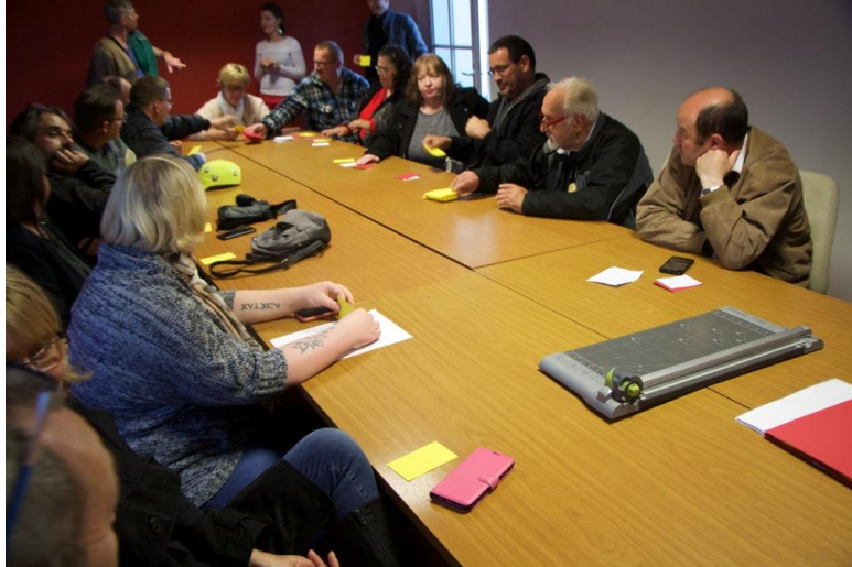
Illustration IV :