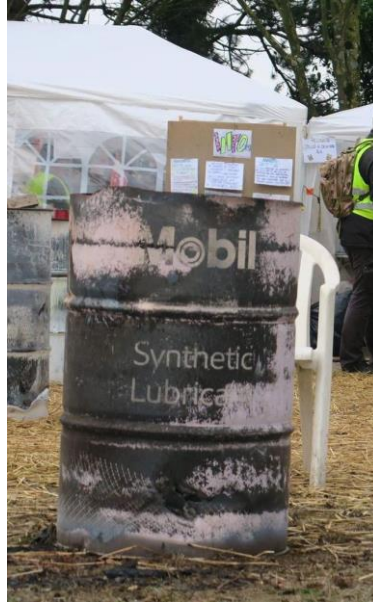
Illustration I :