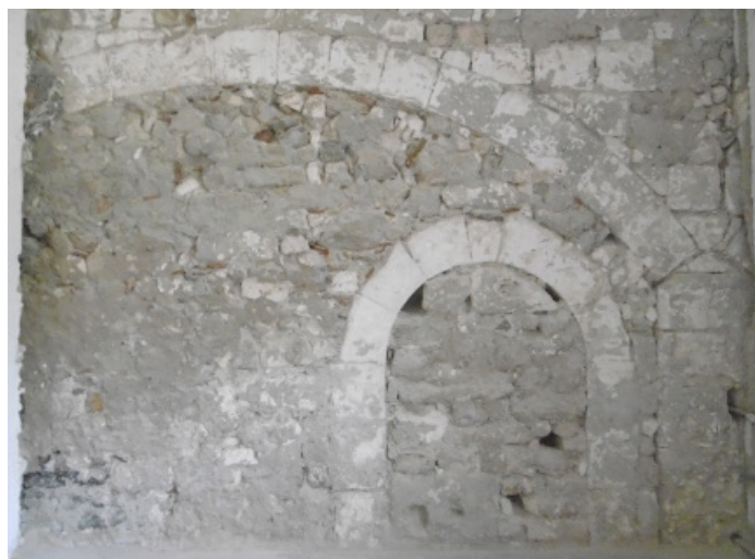
Fig. 10. L'arc au rez-de-chaussée de la maison médiévale, muré dans un second temps.

travaux, en gros sous l'actuel « bâtiment A », donc sur la partie sud de l'ancienne cathédrale, il n'y a pas de place pour un pavement d'une si grande importance. On peut se demander s'il ne s'agit pas plutôt d'un sol en béton de tuileau. En 2009, le suivi des travaux de rénovation dans ce bâtiment a livré plusieurs vestiges d'époque moderne, comme une niche, aménagée dans le mur nord, des niveaux de sol en terre cuite, une citerne et des fosses septiques. Observés sur de faibles emprises, sans véritable fouille, ils demeurent