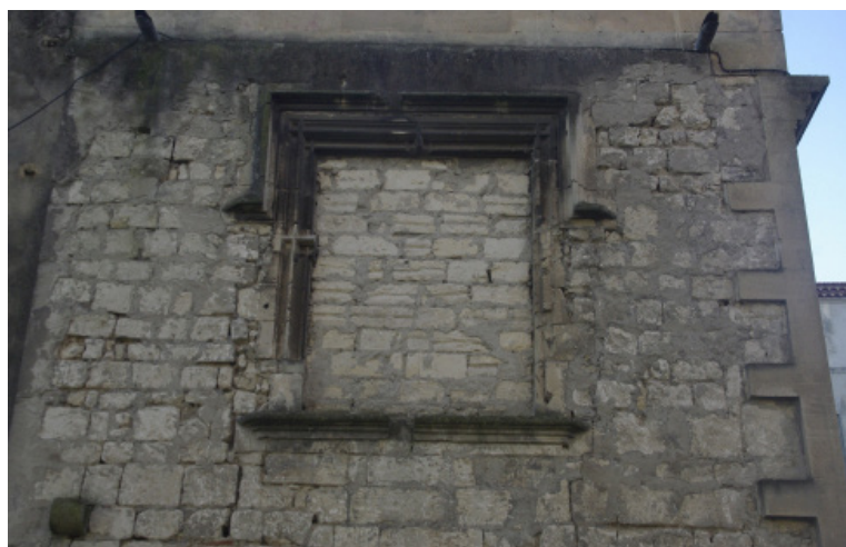
Fig. 6. Fenêtre du XVI e siècle, extrémité nord du « bâtiment B ».

6 Bibl.Nat, Nouv. acq. Lat., 1367, P 277, cité d'après STOUFF, 1996, p. 9-5 ; cf. id. , 2008, p. 398.