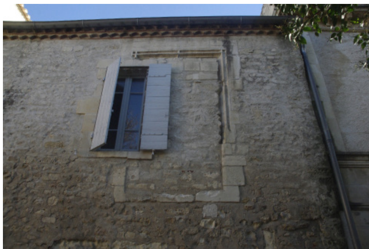
Fig. 5. L'une des fenêtres des appartements des moniales, rue du Grand Couvent (cl. M. Heijmans).

Page de gauche Fig. 3. La tour-escalier, vue de l'ouest (cl. M. Heijmans).