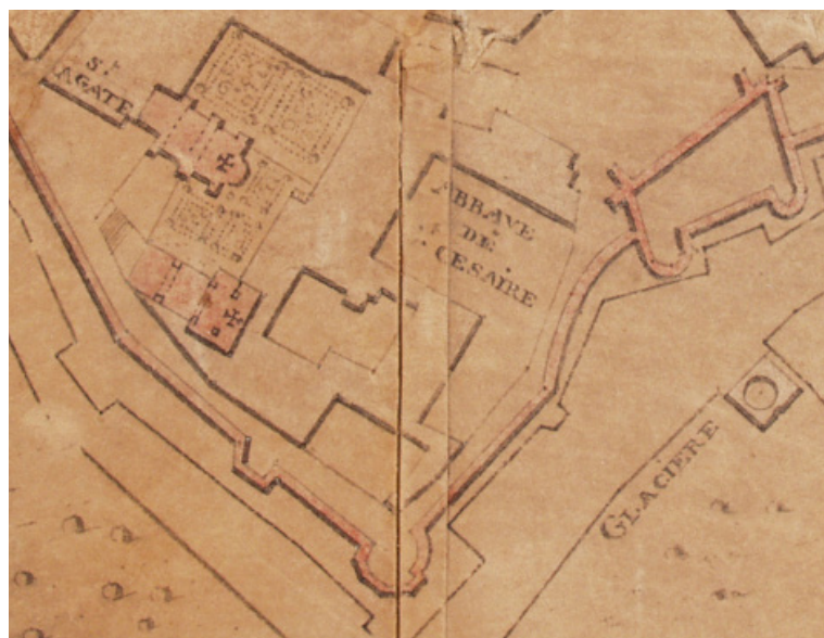
Fig. 8. L'abbaye Saint-Césaire vers 1743 (extrait du plan de Nicolas de Quiqueran de Beaujeu).

Durant une grande partie du XVII e siècle, il y avait donc deux communautés. Le quartier de l'abbesse se trouvait certainement au nord, autour de la grande cour, et celui de la prieure réformée autour de la basse cour, séparée par une aile est-ouest dont on avait vu qu'il était en mauvais état au début du XVII e siècle. Au milieu du XVII e siècle, « ce monastère était entièrement ruiné et inhabitable, sans cloître ni dortoir, les anciennes religieuses logées avec les réformées dans des petites maisons distinctes et séparées, plus propres à l'ancien libertinage de ce lieu qu'à la vie monastique ». Le