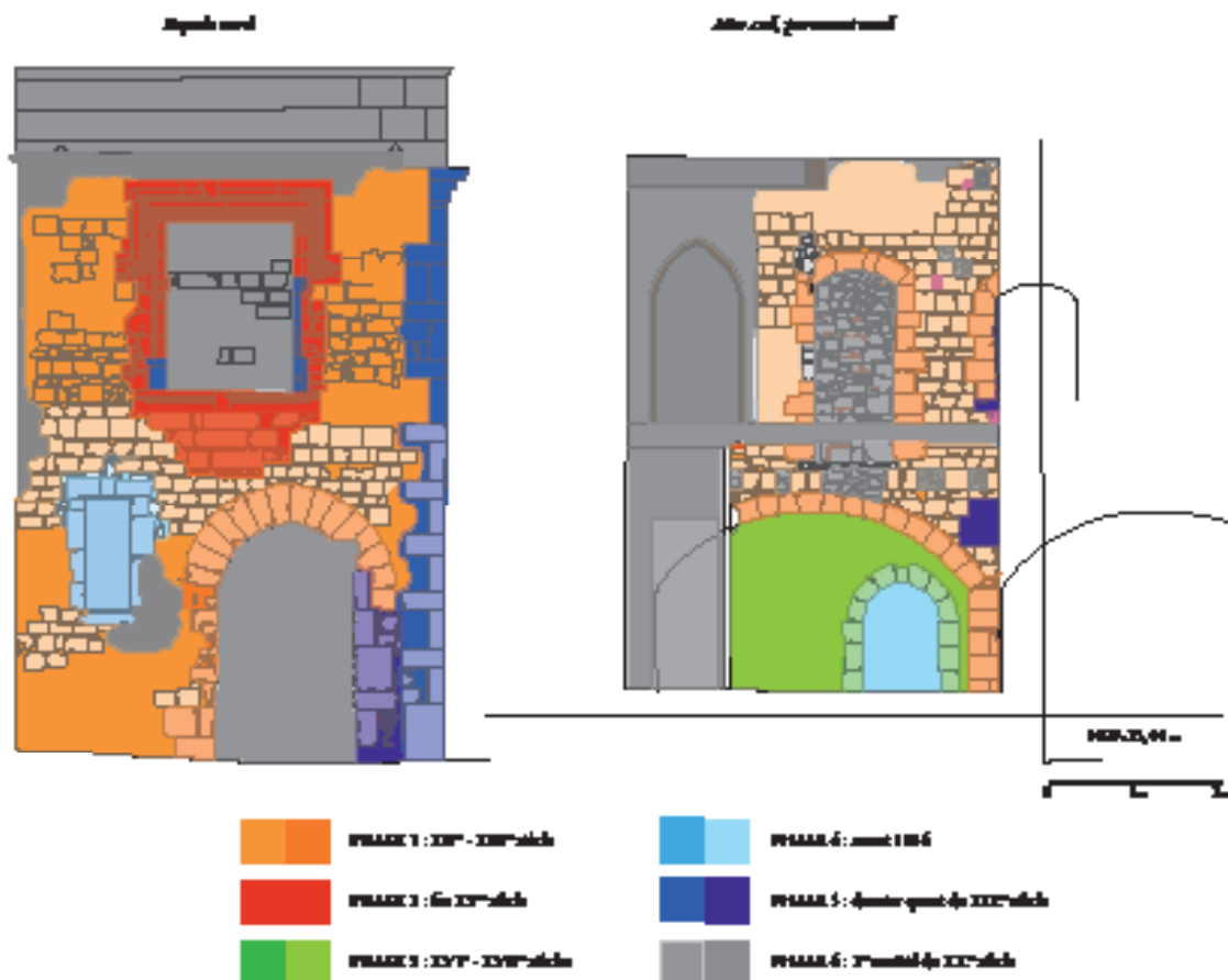
Fig. 2. L'extrémité nord du « bâtiment B » : (relevé et DAO V. Eggert).

d'une grande église antique, sans doute la cathédrale Saint-Étienne. Ce n'est qu'au VIII e ou IX e siècle que la cathédrale est transférée vers l'emplacement de Saint-Trophime actuelle et que l'ancienne église est, petit à petit, spoliée, occupée par des constructions nouvelles ou perforée par des silos. Les murs de l'ancienne cathédrale restent cependant encore longtemps conservés en élévation et ont sans doute été réutilisés en grande partie au moment de la mise en place de l'abbaye bénédictine au XII e siècle. De cet état il reste les églises Saint-Blaise, l'église conventuelle, et Saint-Jean-de-Moustiers, ancienne église paroissiale, intégrée par la suite dans le monastère où elle servait pour l'inhumation des moniales. Lors des travaux dans l'abbaye, d'autres éléments médiévaux ont été mis au jour (fig. 1). Au XIII e siècle, Saint-Blaise est agrandie et des bâtiments s'élèvent au centre de l'ancienne cathédrale, dont un mur aveugle nord-sud et une aile perpendiculaire, encore partiellement conservée (fig. 2). Au siècle suivant, un bâtiment est construit contre la courtine orientale de l'enceinte antique, entraînant la destruction d'une partie de l'abside de l'ancienne cathédrale, mais c'est au XV e siècle que l'on peut attribuer la construction au nord du site d'un grand escalier en vis (fig. 3), doublé au nord d'une pièce voûtée, sans doute la chapelle Notre-Dame de Nazareth, qui servait de chapelle privée pour l'abbesse. C'est également dans cette pièce qu'on