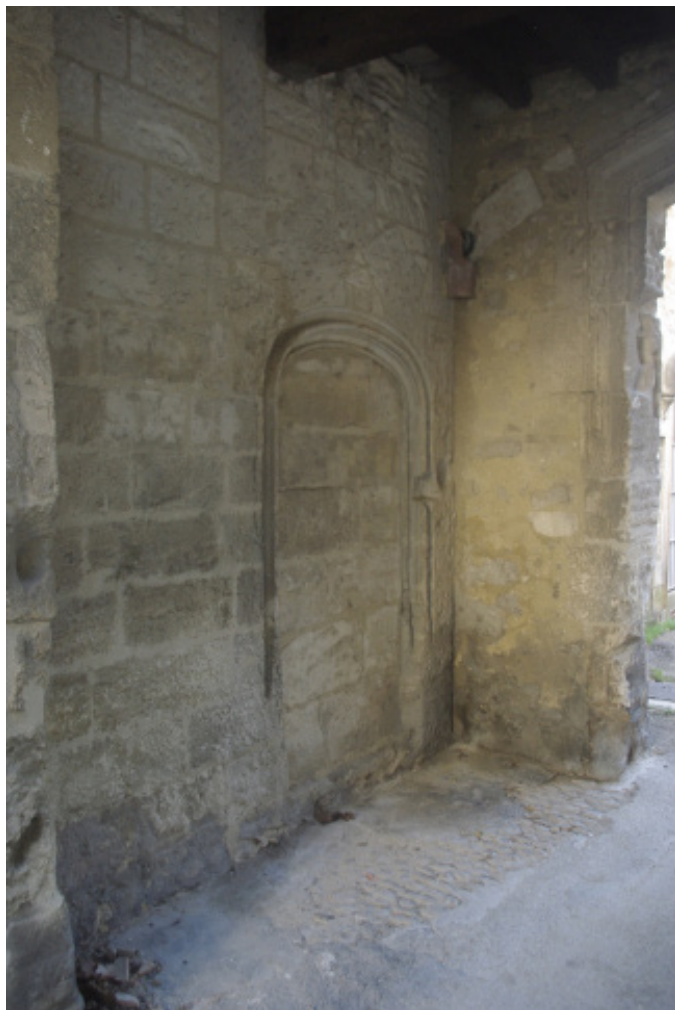
Fig. 4. L'entrée de N-D de Nazareth.