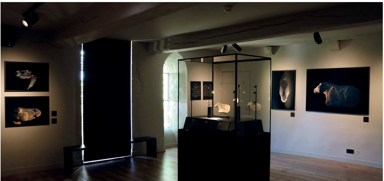
Fig. 1 : Abbaye d'Arthous : salle des trésors.

Les sculptures magdaléniennes sont donc présentées dans un double écrin constitué d'une vitrine centrale et de la chapelle entièrement rénovée. Au centre de la pièce, une vitrine en acier noir mat d'une dimension de 195 x 110 x 70 cm expose les sculptures magdaléniennes à l'aide d'un soclage morphologique sur tige piquée en