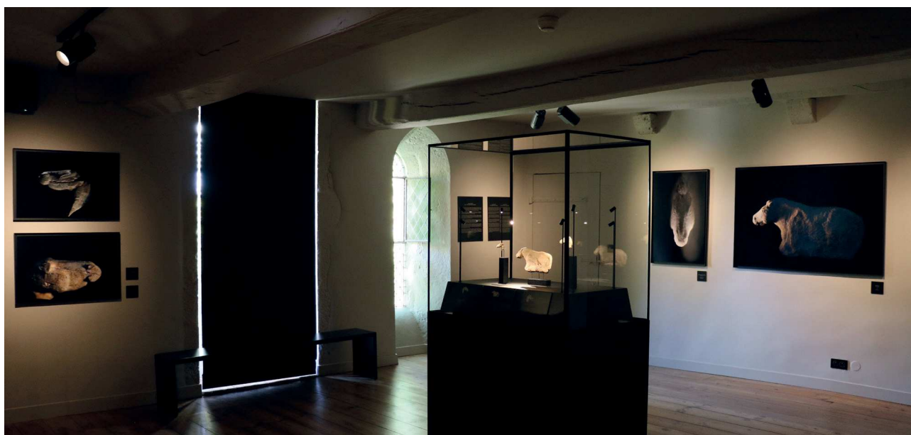
Fig. 1 : Abbaye d'Arthous : salle des trésors.

Les sculptures magdaléniennes sont donc présentées dans un double écrin constitué d'une vitrine centrale et de la chapelle entièrement rénovée. Au centre de la pièce, une vitrine en acier noir mat d'une dimension de 195 x 110 x 70 cm expose les sculptures magdaléniennes à l'aide d'un soclage morphologique sur tige piquée en