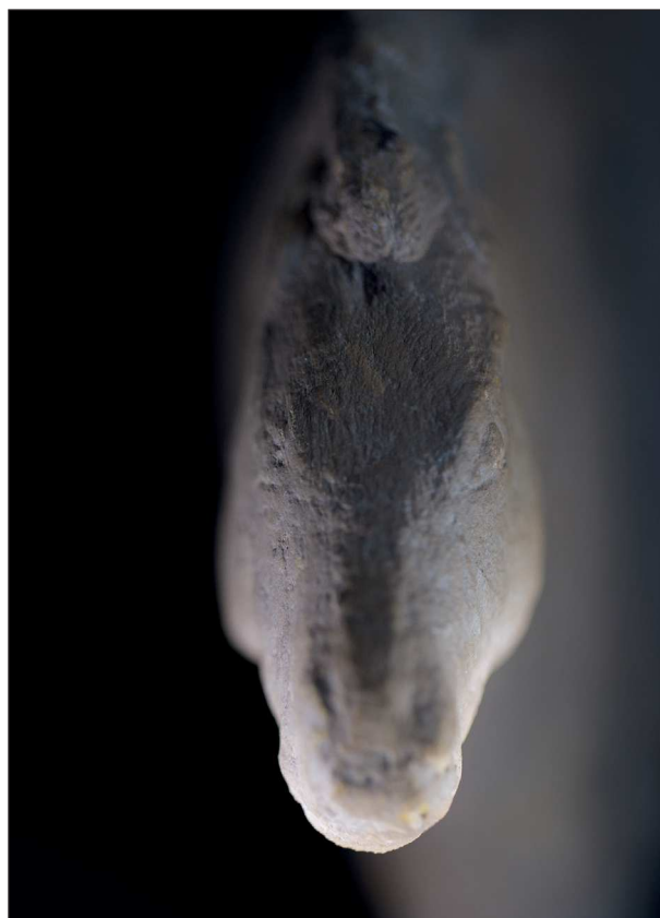
Fig. 3 : « Changement de pied ». Photographie du cheval grès par Claire Artemyz (2019) présentée dans la salle des trésors.

Claire Artemyz a d'abord été médecin et neurobiologiste avant d'entreprendre une formation artistique pour se consacrer à la photographie. En explorant l'univers de la Préhistoire, sa recherche artistique nous interroge sur l'origine et l'identité de l'espèce humaine.