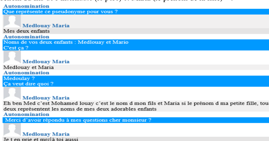
Capture d'écran d'un entretien par messagerie instantané