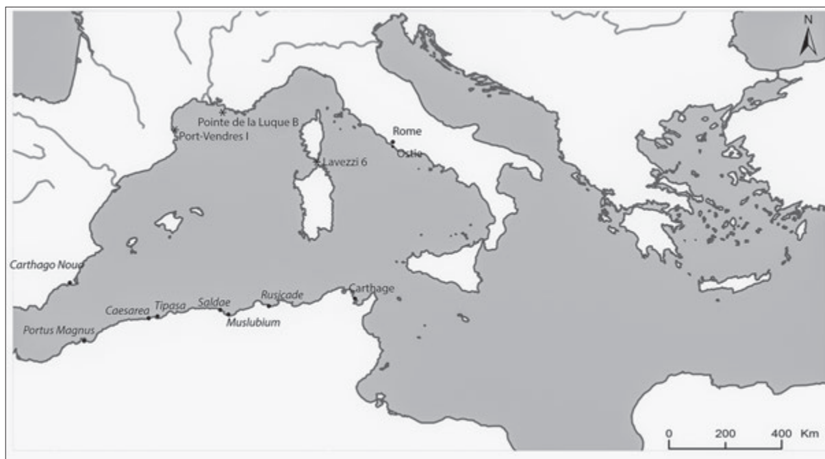
Fig. 1. Les villes littorales de Maurétanie césarienne et de Numidie et le reste du bassin méditerranéen occidental (T. Amraoui).

Le nombre important de ce type recensé à Ostie et à Rome 15 laisse à penser qu'il existait des réseaux d'échanges entre le port de Saldae et l' Urbs et que l'antique Bougie servait de débouché maritime le plus proche à cet arrière-pays riche et mis en valeur. Quelques pressoirs sont signalés