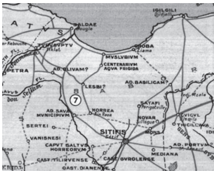
Fig. 2. Stations et réseau routier de la Maurétanie césarienne orientale (SALAMA 1951).

Pour Rome et Ostie, nous disposons d'autres indices de relations économiques entre les deux rives. D'une part, à Rome, l'épithète de Tiberius Claudius Docimus signale qu'il était negotians salsamentarius et uinariarius Maurarius 21 , négociant en salaisons et en vin maures. D'après A. Tchernia, ces produits pouvaient provenir de Maurétanie césarienne et non forcément de Maurétanie tingitane 22 . D'un point de