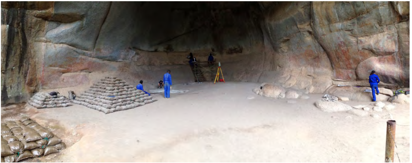
Figure 1 : Vue de l'abri de Pomongwe (Matobo, Zimbabwe) lors de sa réouverture en octobre 2018. La tranchée V dans laquelle ont été retrouvées les écailles de granite peintes se trouve en arrière-plan, au pied de l'échafaudage élaboré pour le relevé rupestre.

données acquises et publiées pour le site de Pomongwe. N. J. Walker mentionne en effet la présence d'écailles peintes dans les niveaux LSA Pléistocène et Holocène, étirant la chronologie de l'art rupestre d'Afrique australe sur plus de 12 millénaires (Walker, 1995). C'est forts de cette première hypothèse que nous avons entrepris une campagne de quatre semaines à Pomongwe du 28 octobre au 25 novembre 2018. L'objectif de terrain visait notamment à s'assurer de l'intégrité des dépôts LSA et à veiller au bon récolement de nos observations de terrain avec celles de N. J. Walker.