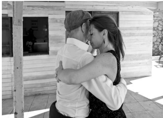
Illustrations 3 : l'enlacement « milongero ».