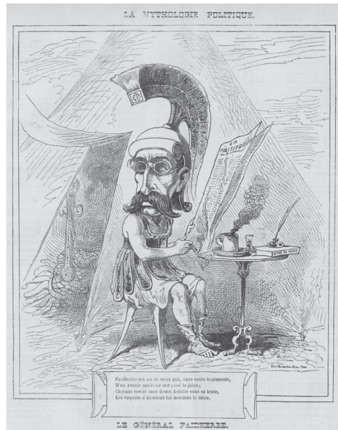
4 nov. 1871 : le général Faidherbe (Achille)