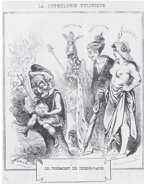
4 avril 1871 : Le Jugement de Thiers-Pâris