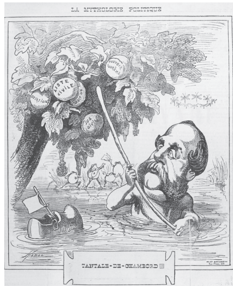
22 février 1872 : Tantalus-de-Chambord