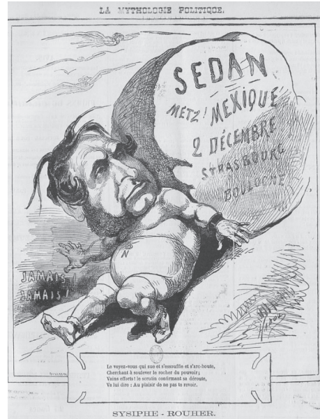
26 juin 1871 : Sisyphus-Rouher