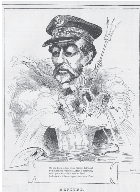
10 juillet 1871 : Neptune (amiral Pothuau)