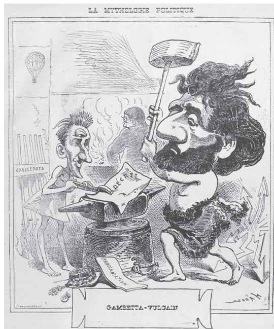
27 février 1872 : Gambetta-Vulcan