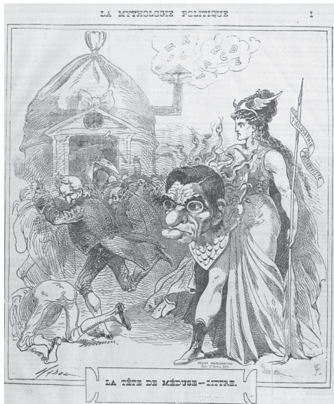
10 janvier 1872 : la tête de Méduse-Littré