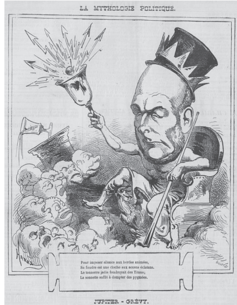
31 août 1871 : Jupiter-Grévy