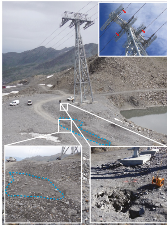
Fig. B : Déstabilisation du pylône n°2 du funitel de Thorens en 2016.

La majorité des dommages a été identifiée au niveau de terrains riches en glace comme des glaciers rocheux. Ils auraient sans doute pu être anticipés et/ou évités avec des diagnostics et études géotechniques plus détaillés et prenant mieux en considération la question du permafrost. Les processus géomorphologiques à l'origine des déstabilisations d'infrastructures sont essentiellement des processus lents, parfois déclenchés par des perturbations anthropiques. Ainsi, le funitel de Thorens (2825 m, Savoie ; Fig. B), construit en 2011, a vu son pylône n°2 déstabilisé en 2016. L'imbrication de facteurs de déclenchement « naturels » comme la dégradation du permafrost et le lessivage des matériaux sous les fondations par l'eau avec des facteurs « anthropiques » tels que la modification de la microtopographie et un déneigement artificiel a entraîné un affaissement du terrain conduisant à basculement du pylône.