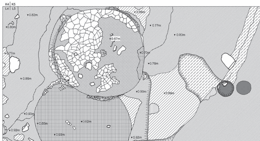
Обр. 3. 1. План на припокриващи се печ и огнище, жилище в кв. L 5 . 2. План на разрушенията на жилища в кв. L 3-4 и M 3-4