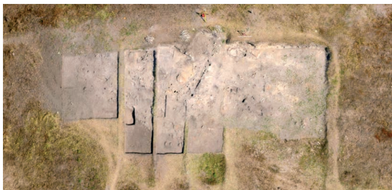
Обр. 2. Изглед от въздуха на проучената площ