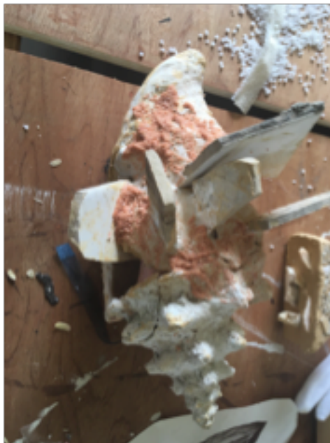
Figure 4. Kelly SINNAPAH-MARY, Recherche et expérimentation, Assemblage coquillage-Carreau , assemblage, 2019 © Sinnapah Mary.