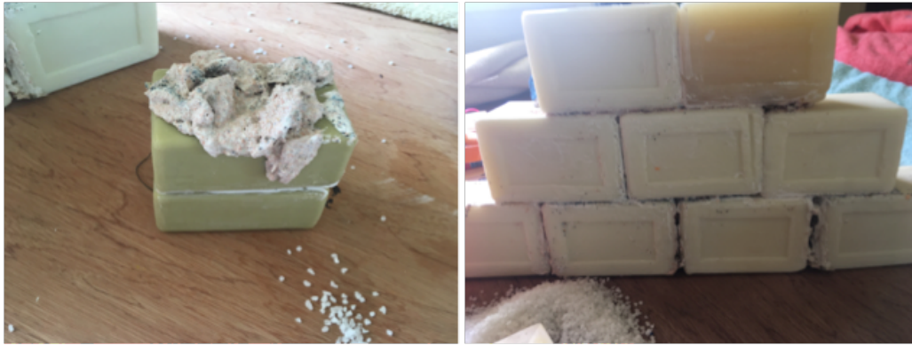
Figure 5 et 6. Kelly SINNAPAH-MARY, Recherche et expérimentation, petite construction savon et mortier de coquillage assemblage , 2019 © Sinnapah Mary.

Kelly Sinnapah Mary est d'origine indienne et le coquillage est porteur d'une charge symbolique imprégnée des légendes lui conférant un caractère précieux, magique, divin.