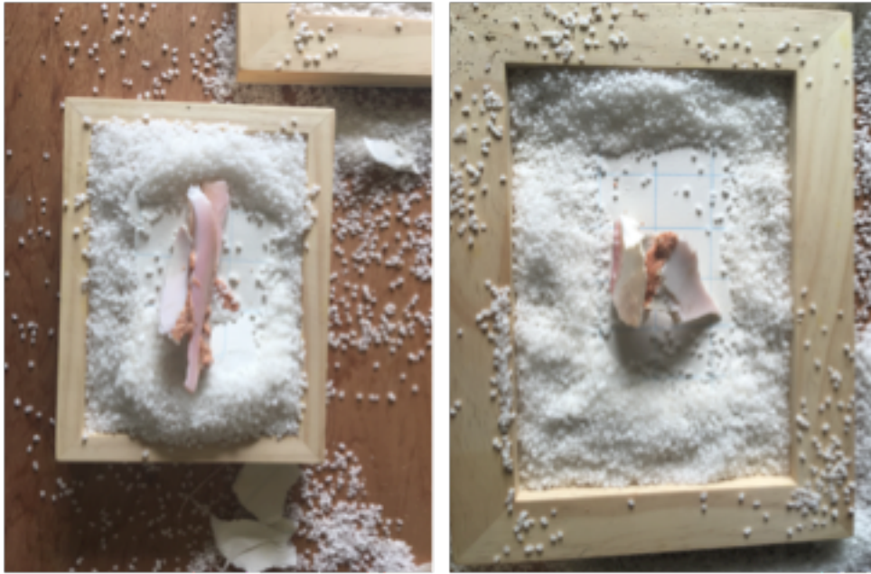
Figure 2 et 3. Kelly SINNAPAH-MARY, Recherche et expérimentation, Fragment de coquillage , assemblage, 2019 © Sinnapah Mary.