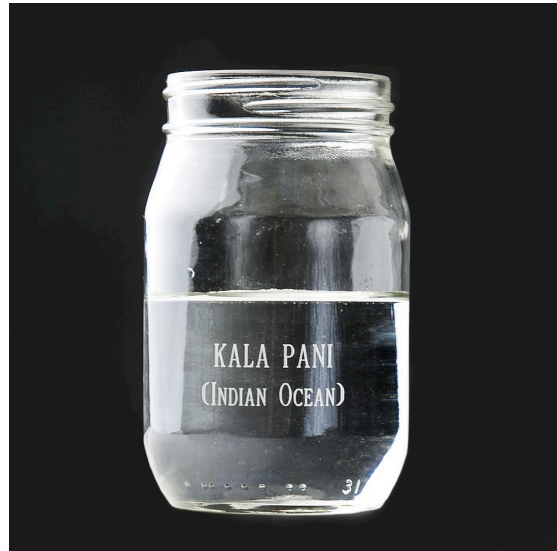
Figure 9. Andil GOSINE, Our holy water and mine , Bocal en verre, eau, 2014 © Andil Gosine.

« coolitude », cette conscience « indo-descendante » ancrée dans la diversité d'images conservée de l'Inde. Le kala pani devient l'effacement, l'engloutissement dans les flots de l'oubli.