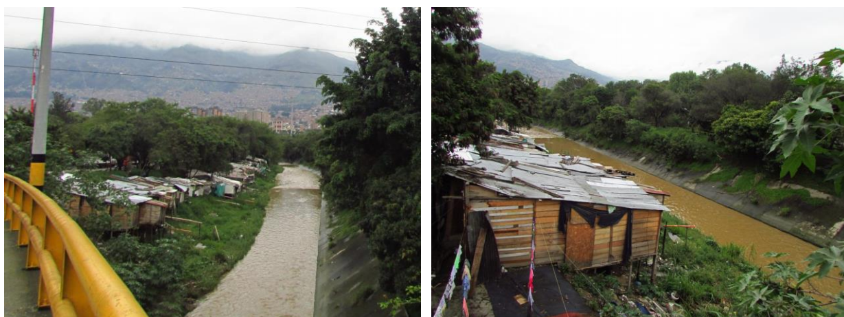
FIGURA 2 : VISTA DE LA COMUNIDAD "LOS RANCHITOS" (IZQUIERDA) Y UNA UNIDAD DE HÁBITAT: RANCHITO.(DERECHA).

El terreno al principio era inclinado, primero tuvieron que aplanar el terreno y luego construir las cabañas. Los hábitats, llamados ranchito, se construyeron con materiales recuperados del vertedero. Principalmente, tablas o puertas de madera. Otros materiales fueron donados por los vecinos. Solo ciertas familias han invertido un poco más en la construcción de cabañas comprando tablones de madera con el paso de los años.