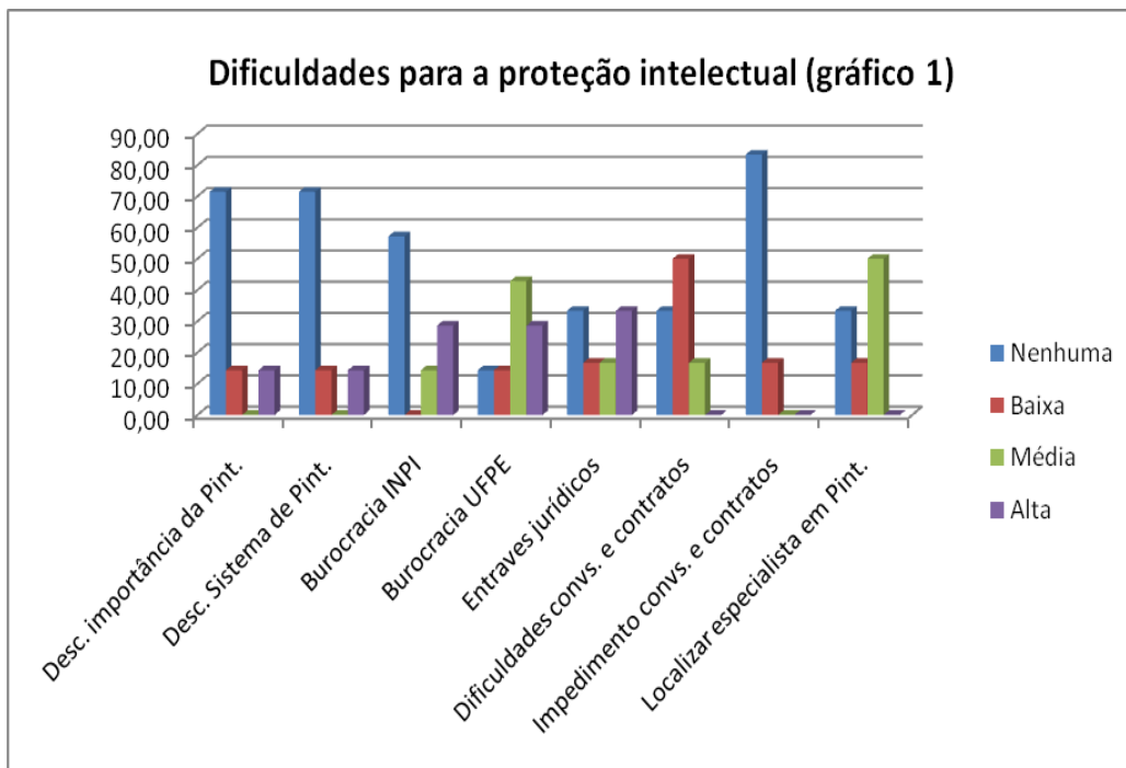
Figura 2. Dificuldades apontadas en la encuesta

Las figuras 2 y 3 muestran las principales dificultades apuntadas por los investigadores para la promoción de la propiedad intelectual (PInt.):