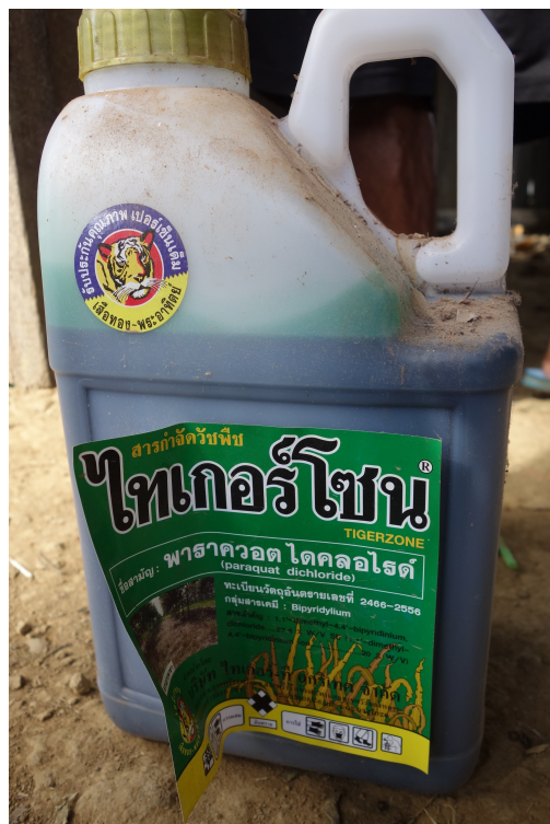
Paraquat, février 2019, Battambang