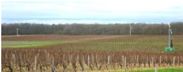
Figure 1. Photo des tours antigel implantées dans le vignoble de Quincy

Le vignoble de Quincy possède 23 tours stationnaires non chauffées et 32 tours stationnaires chauffées au pied du mât par un brûleur. La figure 1 illustre une parcelle de vigne dans un vallon du vignoble de Quincy, équipée de tours antigel fonctionnant en synergie. La tour chauffée (à droite sur la photo) mesure 10.5m de hauteur et l'envergure de ses pâles est de 5.4m. Les tours non chauffées qu'on aperçoit au loin sur la photo font environ 10m de hauteur et ont une envergure de pôle de 6.04m.