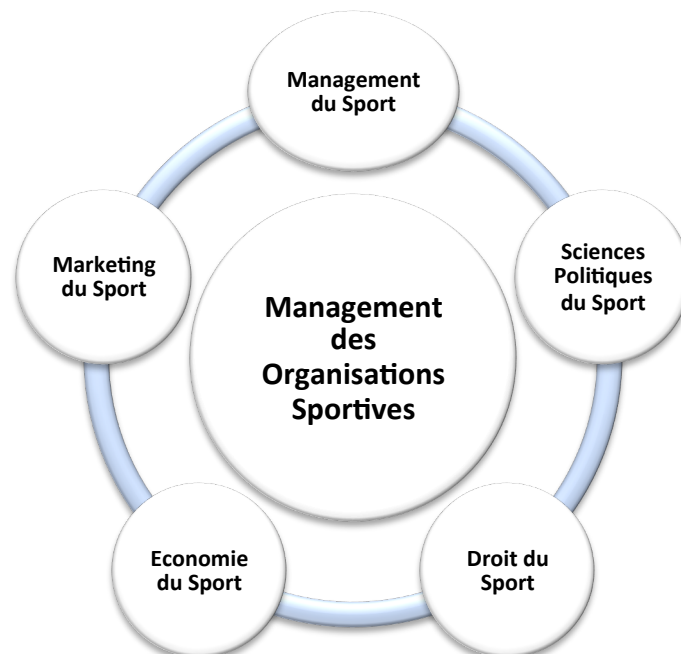
Figure 1. Les 5 dynamiques scientifiques de l'émergence de la recherche francophone en MOS

Des années 1960 aux années 2000, au regard des productions scientifiques des collègues alors jeunes Maître.sses de Conférences et/ou en phase de devenir Professeur.es, il ressort (notamment à travers les ouvrages collectifs et ou les HDR passés) que cinq dynamiques disciplinaires ont contribué à l'avènement de la recherche francophone en MOS (voir Figure 1). Tout en sachant que les travaux en Management et Marketing du sport et en Droit et Economie du Sport ont été les plus prégnants, et que ceux en Sciences Politiques ont davantage été liés aux problématiques des collectivités locales suite à la décentralisation-déconcentration en France.