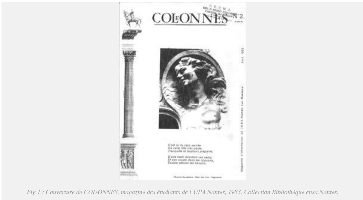
Fig 1 : Couverture de COLONNES, magazine des étudiants de l'UPA Nantes, 1983. Collection Bibliothèque ensa Nantes.

Les deux enseignants italiens ont trouvé les étudiants de Nantes assez résistants car nous ne nous plions pas à leurs règles formelles : nous ne voulions pas exécuter des fenêtres carrées parce qu'Aldo Rossi les dessinait ainsi. 15