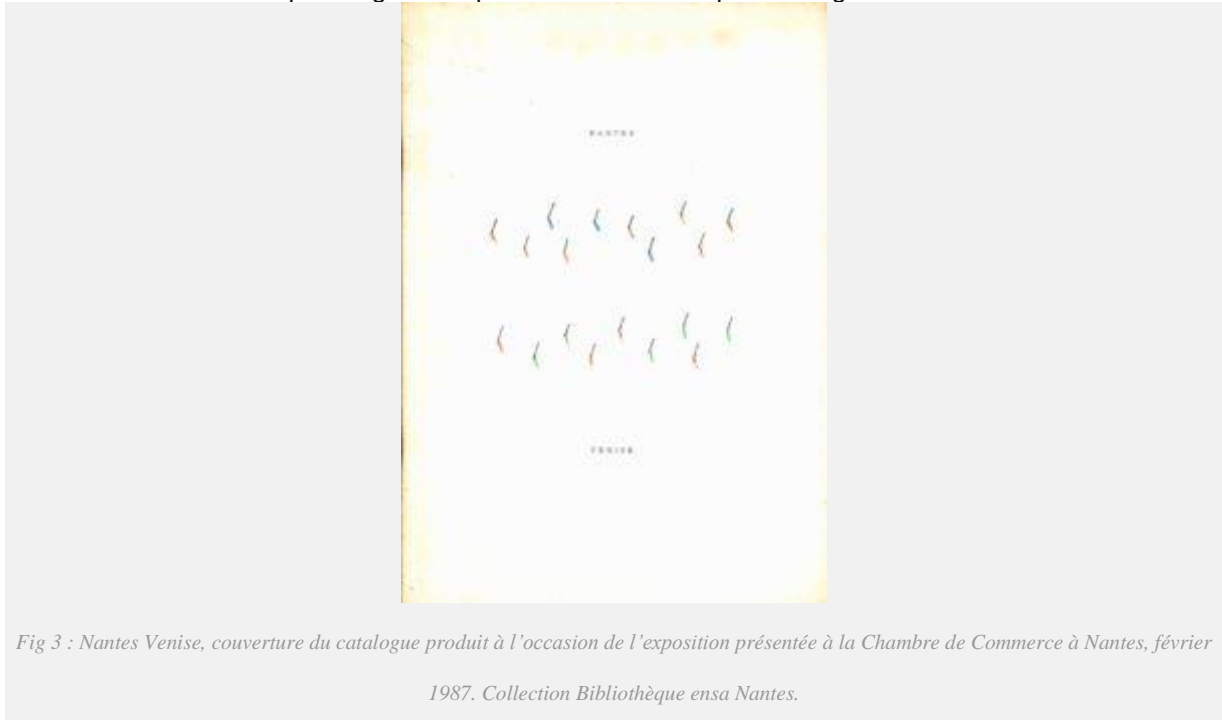
Fig 3 : Nantes Venise, couverture du catalogue produit à l'occasion de l'exposition présentée à la Chambre de Commerce à Nantes, février 1987. Collection Bibliothèque ensa Nantes.

l'occasion de l'exposition suivante, présentée d'abord en Hollande et installée dans le musée du Château de Nantes à l'été 1985 puis aux entrepôts Lainé à l'automne, témoignait d'un intérêt grandissant pour l'architecte milanais. Un livret (fig. 2) a également été publié à l'occasion, s'y trouve en couverture "Iconographie de Nantes", composition analogue représentant différents édifices ou projets, offerte à l'occasion de la première exposition. Dix projets et réalisations sont présentés, les plus anciens étant le cimetière San Cataldo à Modène et le Théâtre du Monde et des projets du début des années 80 illustrés par de grandes planches et des maquettes originales.