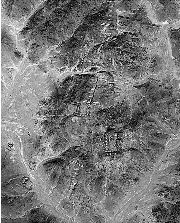
Fig. 6. Photographie satellite de Samut en 2013, avant la fouille et les destructions de la compagnie minière.