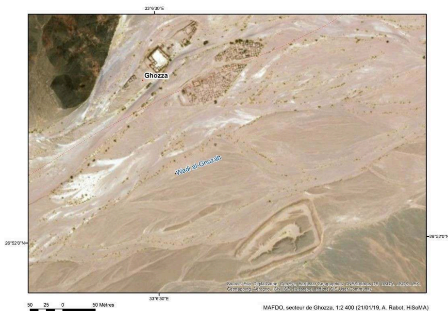
Fig. 2. Photographie satellite de Ghozza et ses environs.