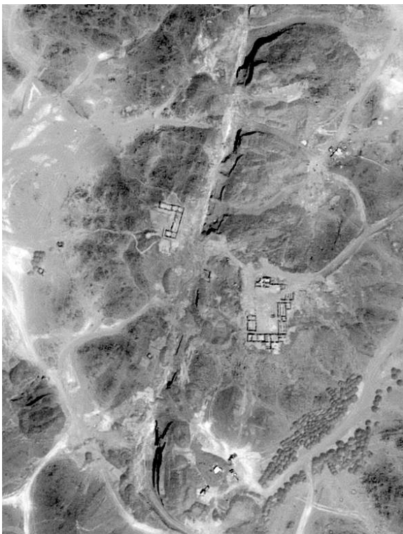
Fig. 7. Photographie satellite de Samut en 2018.