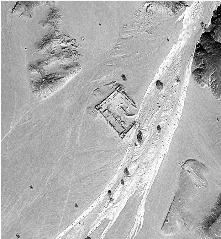
Fig. 4. Photographie satellite de Bi'r Samut en 2013, avant la fouille.