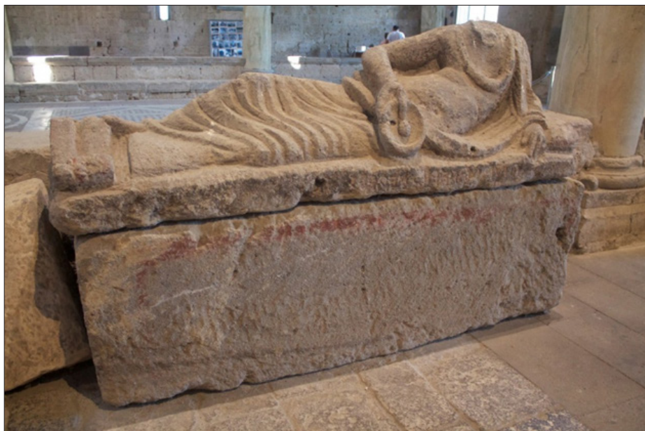
Illustration 5 : Sarcophage en tuf de l'Église San Pietro à Tuscania, III ème siècle av. n. è.

En outre, on a souvent noté le caractère chthonien plus développé des divinités étrusques en regard des panthéons grec et romain 37 . La libation de vin, qui établit un lien vertical 38 entre les hommes et la terre 39 , quel que soit, du reste, le dieu invoqué, a pu être perçue comme une pratique centrale dans le domaine étrusque. On a pu supposer, en effet, dans le cas des religions votives, qu'au sang des victimes animales correspondrait un équivalent végétal dans les liquides issus de l'agriculture que sont le vin, le lait ou le miel, produits de la terre nourricière 40 .