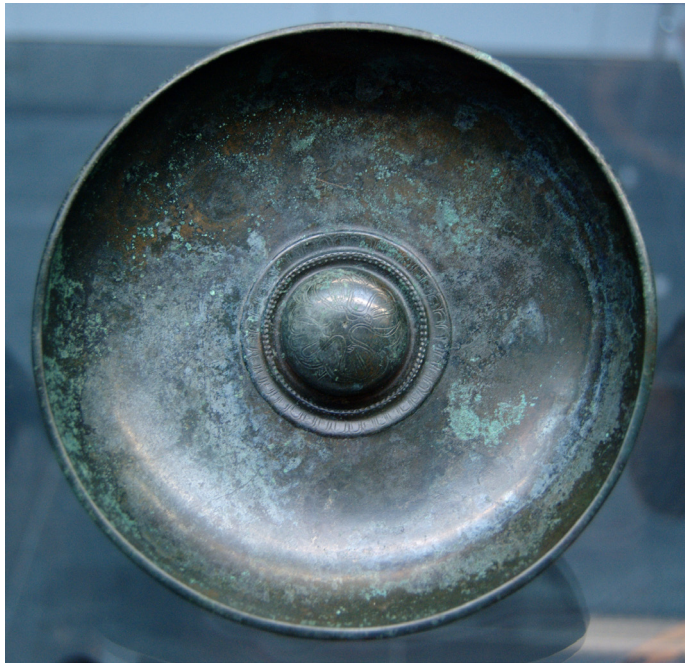
Illustration 1 : Phiale mesomphalos en bronze en provenance de Grèce, vers 500 av. n. è. Staatliche Antikensammlungen, Munich.

de farine blanche s'ajoute à la triple libation 10 . Dans le cas de la nécromancie, en outre, le vin pur est requis, ce qui est une aberration dans le monde des vivants 11 . Mais il s'agit d'un cas exceptionnel : au culte des morts est lié l'emploi de choai d'eau pure, dont la fonction est de purifier la souillure inhérente à la mort.