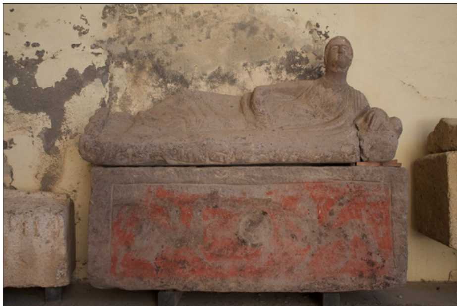
Illustration 6 : Sarcophage du Musée de Tarquinia, III e s. av. n. è.

phages ou les urnes qui représentent une femme dans la même posture. Il en va de même sur les peintures, ou les autres images. Ce point mérite d'être souligné. En effet, si l'accès au vin semble avoir été très limité pour les femmes grecques et romaines, tel n'est pas le cas pour leurs consœurs étrusques, qui, à l'instar de certaines « femmes puissantes » de Gaule 53 , deviennent de véritables partenaires commensales 54 .