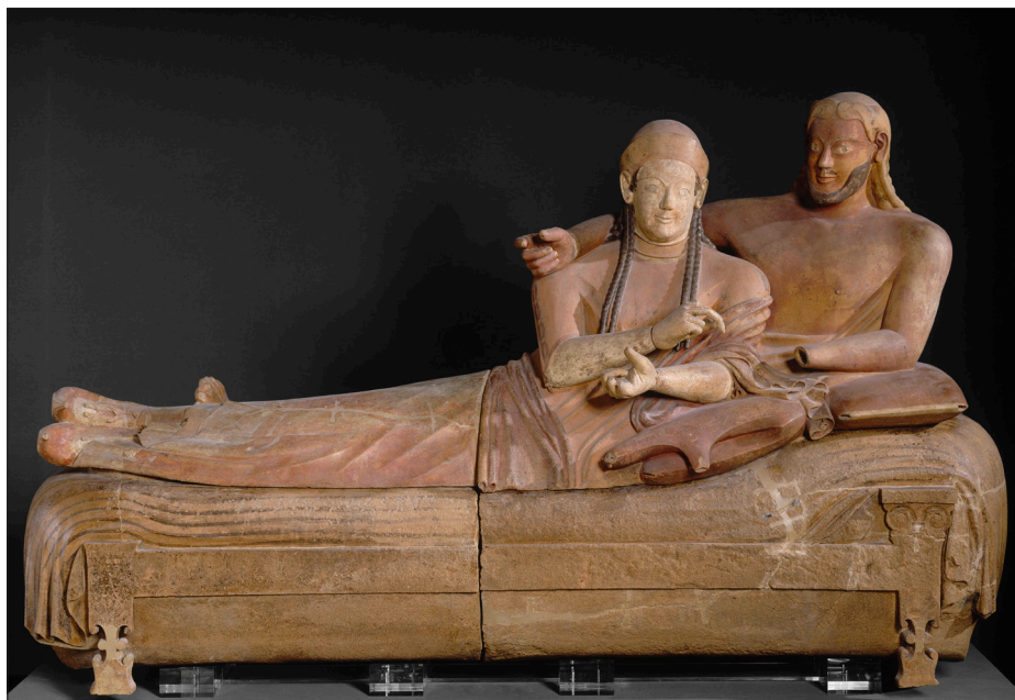
Illustration 4 : Sarcophage des Époux de Cerveteri en terre cuite, vers 520 av. n. è., Paris, Musée du Louvre, Photo © RMN-Grand Palais (musée du Louvre) / Hervé Lewandowski

Le second constat réside dans le caractère relativement rare de la représentation de la vigne et du vin dans l'iconographie étrusque. J.-R. Jannot avait déjà constaté que les banquetteurs, en contexte funéraire, ne buvaient jamais 35 . Quant à la vigne et au raisin, ils apparaissent étonnamment assez peu dans les représentations figurées alors que le banquet y est omniprésent. Cette éloquente absence sur les images nous invite à inférer la présence effective de ces éléments dans les rituels funéraires, comme le suggèrent, du reste, les services à boire retrouvés dans les tombes, ou les restes organiques de pépins de raisins 36 . Ainsi, sur les scènes de préparatifs du symposium peintes sur la paroi de gauche de la Tombe Golini I d'Orvieto, où l'on peut voir des esclaves disposant des grappes de raisin noir sur des plats.