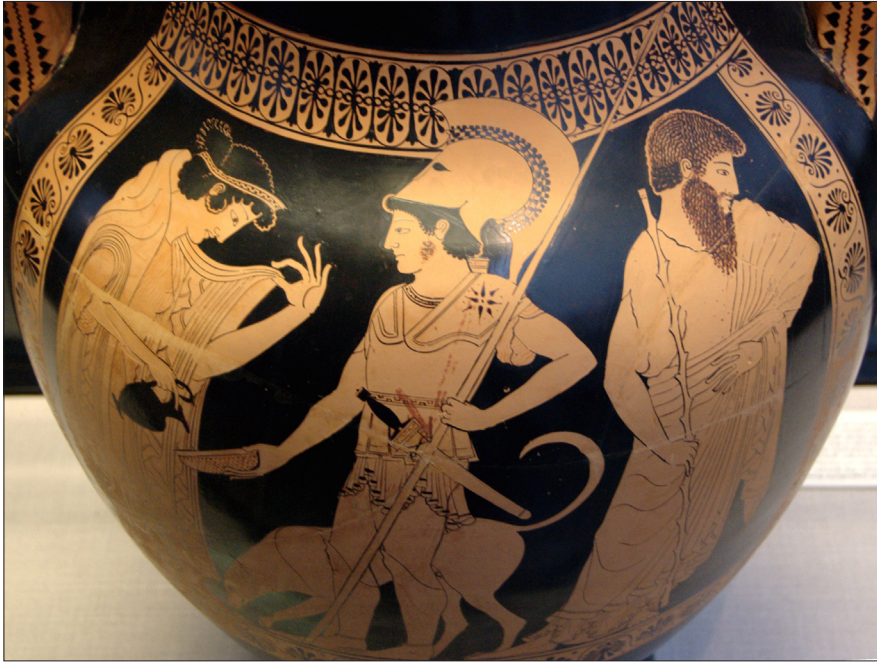
Illustration 3 : Libation avec oenochoé et phiale à l’occasion du départ du guerrier, face A d’une amphore à panse attique à figures rouges trouvée à Vulci, métropole étrusque, vers 500-490 av. n. è. Staatliche Antikensammlungen, Munich.