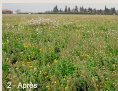
2 - Après