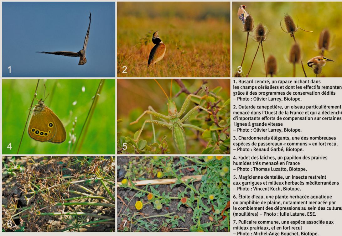
1. Busard cendré, un rapace nichant dans les champs céréaliers et dont les effectifs remontent grâce à des programmes de conservation dédiés – Photo : Olivier Larrey, Biotope. 2. Outarde canepetière, un oiseau particulièrement menacé dans l'Ouest de la France et qui a déclenché d'importants efforts de compensation sur certaines lignes à grande vitesse – Photo : Olivier Larrey, Biotope. 3. Chardonnerets élégants, une des nombreuses espèces de passereaux « communs » en fort recul – Photo : Renaud Garbé, Biotope. 4. Fadet des laïches, un papillon des prairies humides très menacé en France – Photo : Thomas Luzatto, Biotope. 5. Magicienne dentelée, un insecte restreint aux garrigues et milieux herbacés méditerranéens – Photo : Vincent Koch, Biotope. 6. Étoile d'eau, une plante herbacée aquatique ou amphibie de plaine, notamment menacée par le comblement des dépressions au sein des cultures (mouillères) – Photo : Julie Latune, ESE. 7. Pulicaire commune, une espèce associée aux milieux prairiaux, et en fort recul – Photo : Michel-Ange Bouchet, Biotope.

linaires, etc.), mais ils peuvent aussi mettre en œuvre volontairement, individuellement ou collectivement, des mesures de compensation pour le compte de tiers. Ils ont alors le rôle d'« opérateurs de compensation écologique » au sens de la loi sur la biodiversité. Dans ce cadre, les maîtres d'ouvrage, qui restent néanmoins responsables de la bonne exécution des mesures prévues dans leurs autorisations administratives, confient par contrat la réalisation des mesures correspondant à tout ou partie de leur dette compensatoire aux exploitants agricoles. Les organisations associées à l'activité agricole des territoires comme les sociétés d'aménagement foncier et d'établissement rural (SAFER), les chambres d'agriculture, les coopératives ou syndicats agricoles peuvent accompagner les agriculteurs dans le montage et la mise en œuvre de ces compensations écologiques. Les agriculteurs peuvent également mettre en place et/ou intervenir dans un site naturel de compensation 2 (SNC), seuls ou en groupe 3 , mais aucun exemple de SNC mis en place par des acteurs agricoles n'est recensé à ce jour.