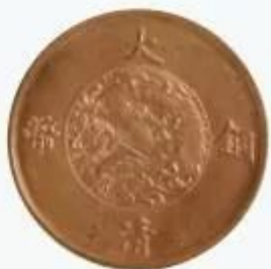
宣統三年二十文大清銅幣，重量16.4克，直徑34.4毫米。