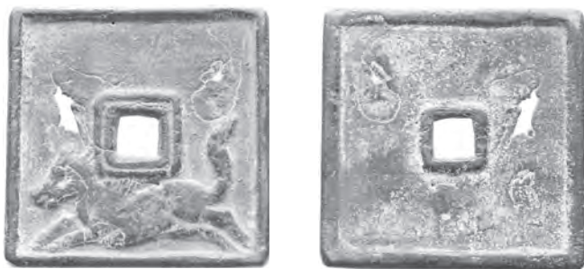
Illustration Ia : Bronze, l. 47 mm, 42,65g, Oxford, Heberden Coin Room. Création à partir d'une illustration fantaisiste du Qinding qianlu 欽定錢錄 (Catalogue des monnaies sur Ordre Impérial).

de monnaies, grâce notamment aux courriers et aux notes publiées de Bao Kang, il continua à être sollicité pour des achats de monnaies ou des estampages. Ses estampages sont intéressants car ils donnent à voir quelles monnaies étaient collectionnées à l'époque, et notamment quelles étaient les nouvelles monnaies qui apparaissaient sur le marché de la collection. Ils éclairent aussi la logique de fabrication d'un faussaire entre réplique parfaite, fabrication de monnaies signalées dans les sources historiques, mais dont aucun exemplaire n'a encore été découvert, ou création de raretés qui ont pu exister.