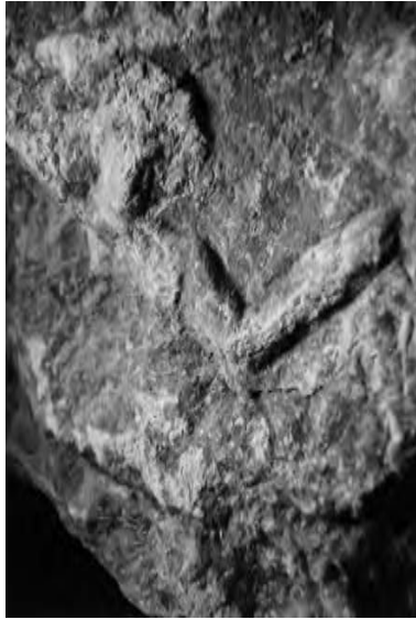
Fig. 13 — F8 Muse, détail du relief.