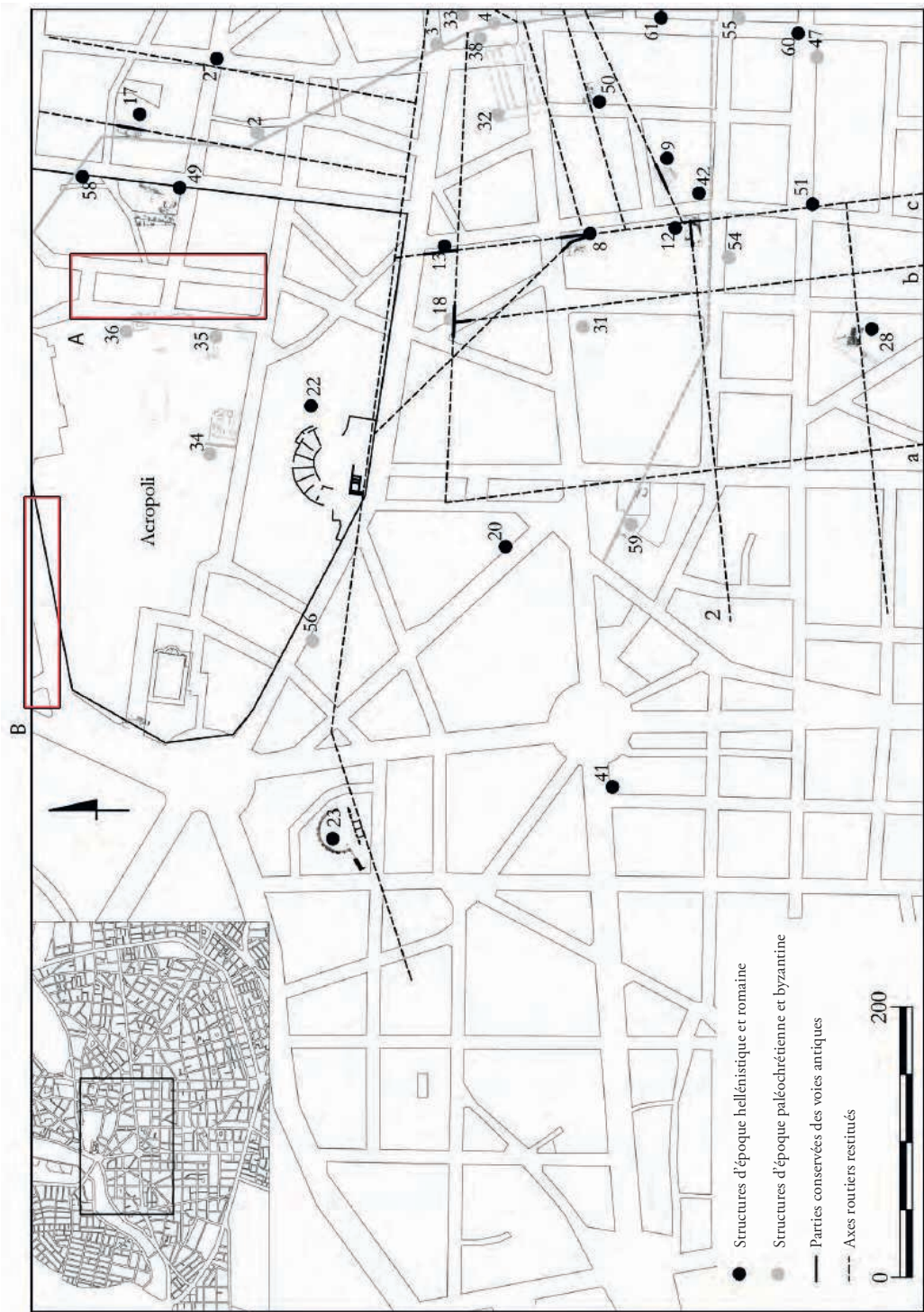
Fig. 16 — Plan de la zone centrale de Larissa à l'époque hellénistique et romaine d'après GERGIANNIS 2018, p. 163. A. Zone de trouvaille de la stèle des Muses. B. Zone où pouvaient se situer les « Thalamai » et le Mousaion .