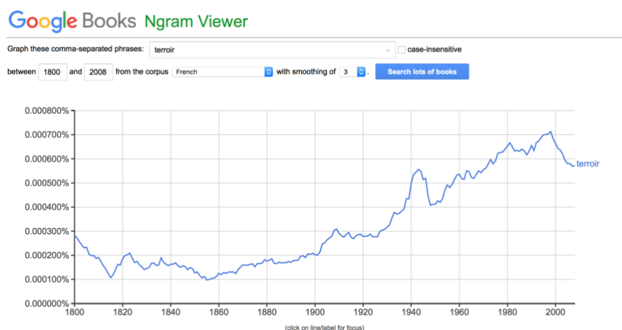
figure 2 – Evolution du nombre de citations du mot « terroir » dans un corpus d’ouvrages en français (1800-2008).