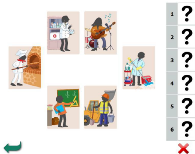
Figure 4. Ecran correspondant au jeu de « classement des métiers » (3 ème questionnaire-jeu)

NB : La consigne orale commençait comme suit : « Tu vois maintenant 6 métiers sur l'écran. Dans ce jeu, tu vas ranger les métiers depuis celui que tu préfères jusqu'à celui que tu aimes le moins » et poursuivait en présentant les 6 cartes-personnages, disposées de manière aléatoire sur l'écran : « il y a un ouvrier ou une ouvrière, un maître ou une maîtresse d'école, un chanteur ou une chanteuse, un boulanger ou une boulangère, un homme ou une femme de ménage, un ou une docteur(e) ».