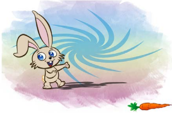
Figure 6. Elfi se présente.

« Bonjour, je m'appelle Elfi. Je te propose de faire de petits jeux où tu vas pouvoir choisir les choses ou les personnages que tu aimes bien. Tu vas commencer par choisir le personnage qui te ressemble le plus. Appuie sur la carotte pour commencer. » (Consigne énoncée oralement)