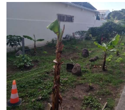
Ex: Jardin partagé, de l'habitant au projet (Butor)