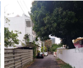
Ex: Manguier sur la rue, entre espace privé et public (Vauban)