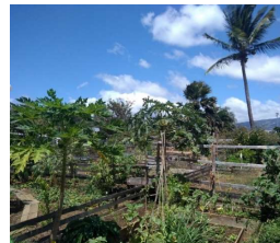
Ex: Jardins partagés, appropriation du projet (Chaudron)