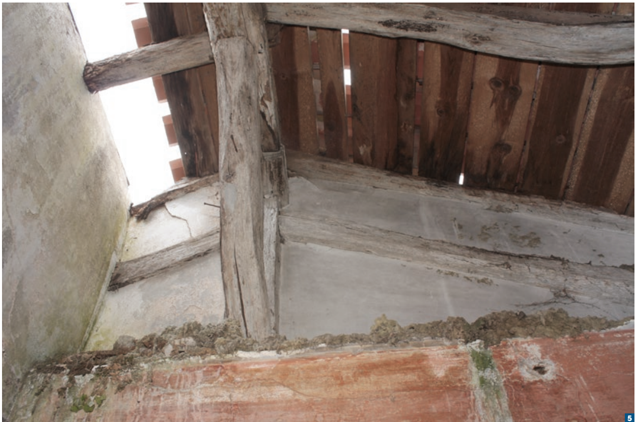
Intérieur du logement 3 en 2009 avec la ferme de charpente au-dessus de la cloison principale et la cloison séparant les deux petites pièces montant jusqu'au voligeage.