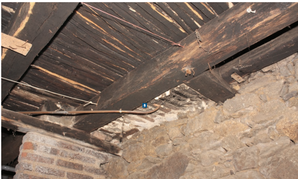
Détail du plancher cave du logement 3 dans son état en 2009 avec ses surfaces noircies.