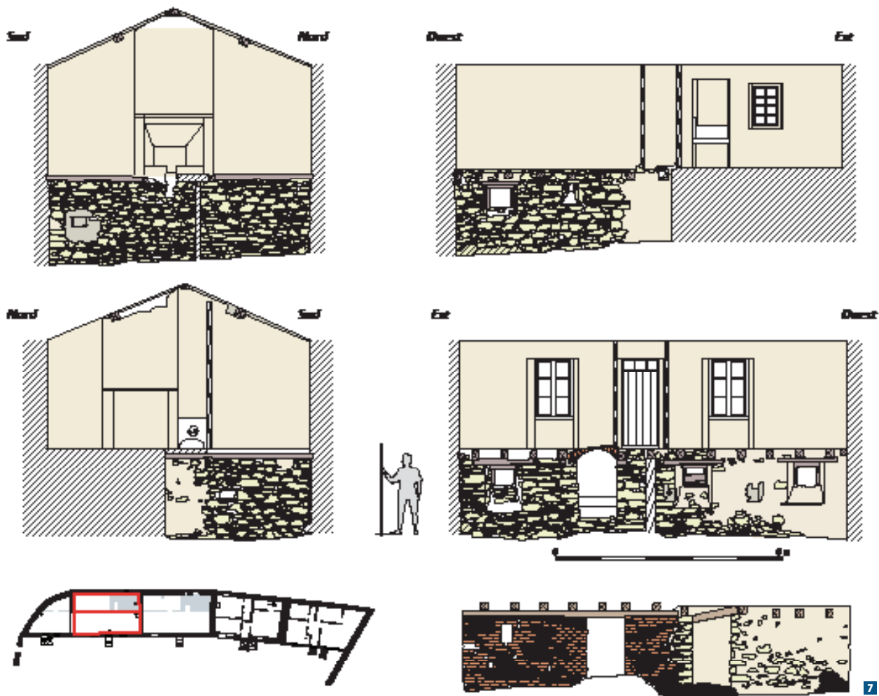
Élévations intérieures de l'unité 4 avec les matériaux visibles, le trait rouge indique le positionnement des élévations avec en bas à droite le mur de séparation de la cave.