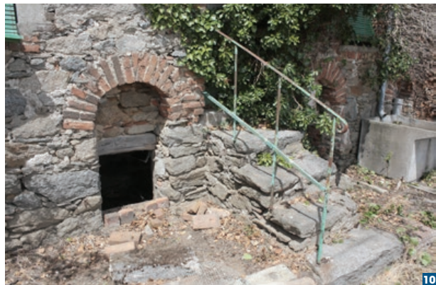
Soupirail de la cave du logement 3.

Le cinquième logement de forme polygonale est coincé à l'extrémité ouest des quatre déjà décrits 4 . Le coup de sabre montre bien son adjonction postérieure, mais il est dans la parfaite continuité du mur de clôture. Cela conduit à placer la réalisation du portail d'entrée lors de la réalisation de cette unité. Le rez-de-chaussée est constitué d'une pièce unique de 21 m 2 avec une cheminée au milieu du mur oriental dont ne subsiste que le chevêtre de plancher recevant la sole. Un évier installé dans un placard complète l'aménagement. L'accès se fait par une porte centrée sur la façade que complète une fenêtre. L'accès à la cave placée à l'ouest et deux soupiraux y apportent un éclairage naturel. Dans la cave, dont le plafond est également noirci, le mur ouest présente un creux