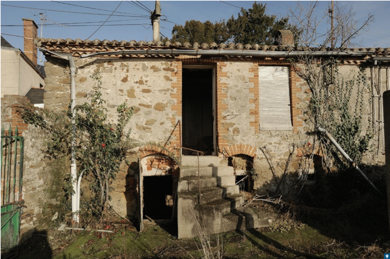
Façade du logement 5.