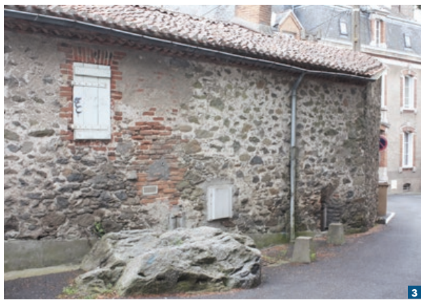
Vue prise en 2009 de la façade nord du logement 4 avec sa baie éclairant la pièce de service et le parement de briques formant le fond de la niche à évier ; à noter le rocher qui affleure.

On accède au rez-de-chaussée surélevé par une porte précédée d'un petit perron de quatre ou cinq marches centrée sur le logement. Elle ouvre sur une pièce dotée d'une cheminée placée au centre du pignon. Une cloison, faite de briques posées sur champ, la sépare de deux petites pièces. La première, sans doute une chambre, donne sur le jardin, tandis que la seconde, qui dispose d'un évier et d'une petite fenêtre donnant sur la rue, est une pièce de service, sans doute la cuisine. Les cloisons anciennes, enduites au plâtre avec une armature bois, montent jusqu'à rejoindre le voligeage 5 . C'est donc une habitation composée de trois pièces montant sous charpente. Le plan est le même pour trois des quatre habitations ; le rez-de-chaussée de l'habitation orientale ayant été totalement reconstruit en parpaings de ciment. Les deux premières habitations sont traitées en miroir permettant ainsi