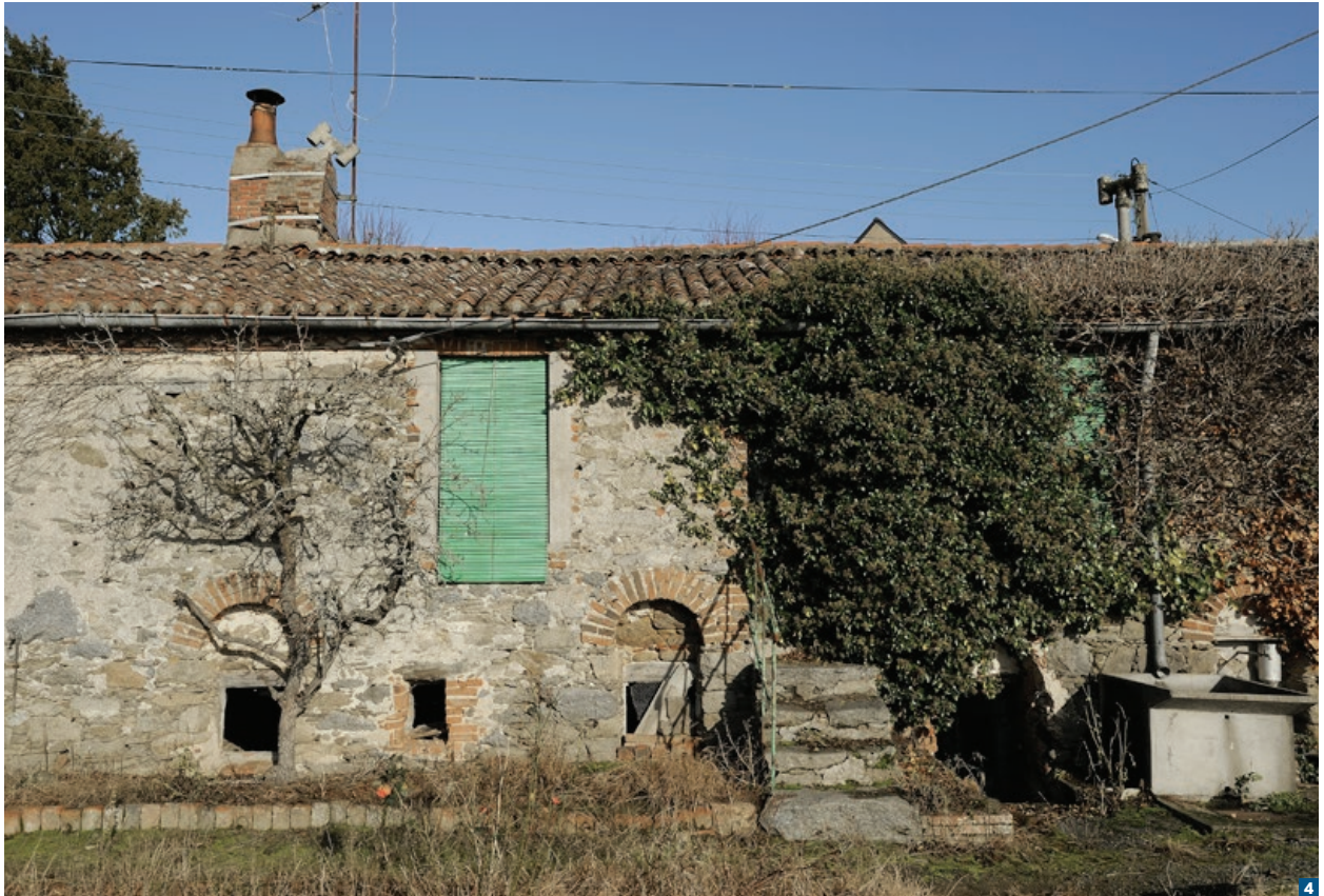
Vue prise en 2009 de la façade sud du logement 3.