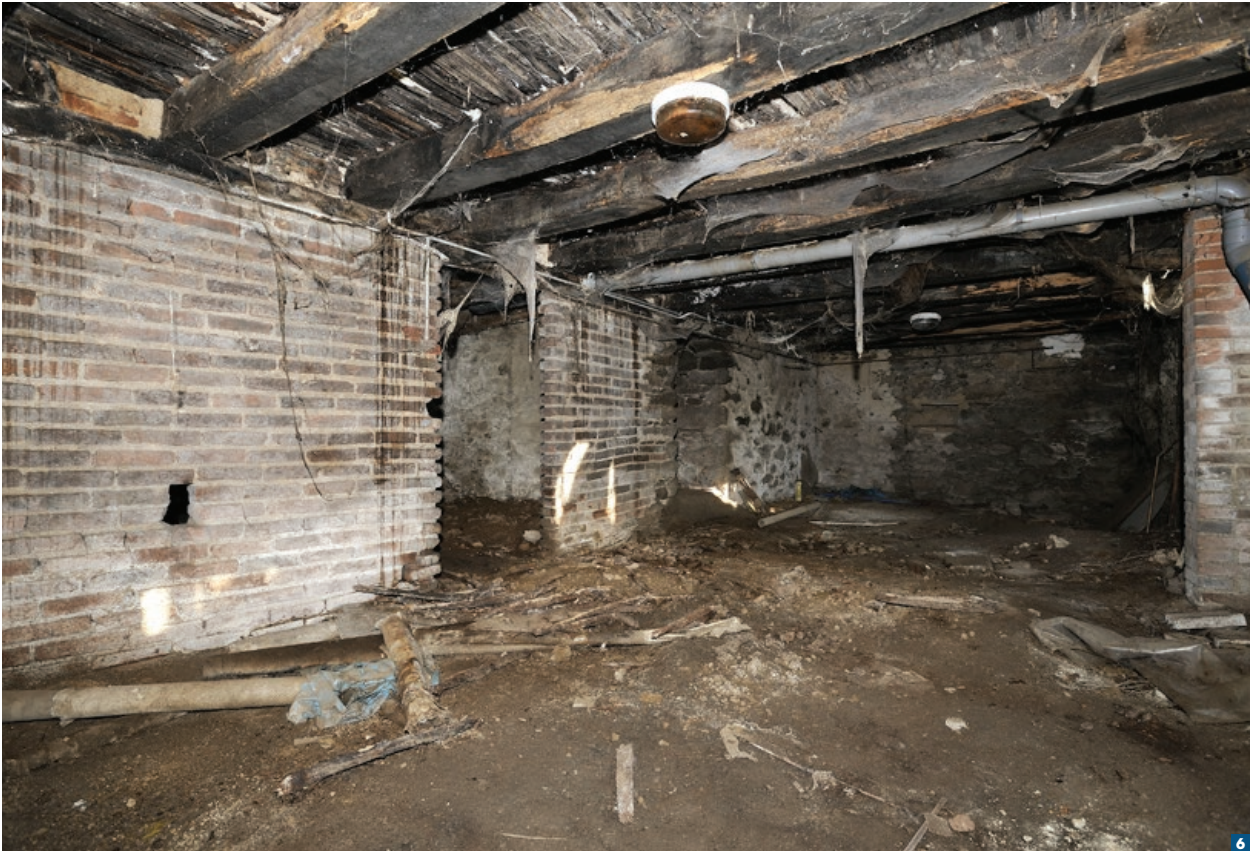
La cave du logement 4 dans son état en 2009.