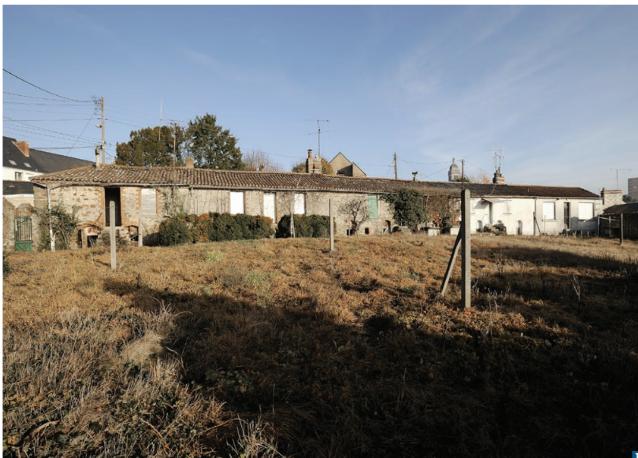
La suite de logements prise en 2009 depuis l'angle sud-ouest du jardin du 28 rue de Livet à Cholet

d'entre elles présentent des caractères semblables tandis que la cinquième, plus petite, s'inscrit dans l'angle au nord-ouest de la parcelle. Nous débuterons par les quatre unités, identiques malgré quelques adaptations et modifications inhérentes à des logements ayant reçu plusieurs générations d'occupants. L'accès se fait pour chaque maison à partir du jardin. Seules la seconde et la troisième à partir de l'est disposent d'une porte percée postérieurement à la construction donnant directement sur la rue 3 . Chacune de ces cinq unités se structure entre un sous-sol et un étage d'habitation ouvert au sud 4 . Avec leurs 8,4 m de longueur en façade et une emprise de 62 m 2 , trois des quatre logements n'offrent qu'une surface habitable de 48,5 m 2 . Le logement oriental suit la forme de