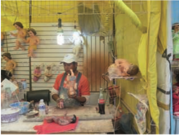
5. Clinique de Niño Dios

Que se passe-t-il pour Niño Dios durant le mois qui précède la Chandeleur ? On s'emploie à le vêtir et, si besoin, on l'amène dans des ateliers appelés clínicas , consultorios ou hospitales [Ill. 5], parfois marqués d'une croix rouge, et dans lesquels des spécialistes aux allures de « docteurs » le répareront (on dit parfois le « soigner ») après une mauvaise chute ou contre l'usure du temps.