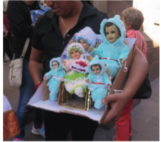
6. Les nouveaux habits de Niño Dios

Centre-ville de Mexico, 23 janvier 2018