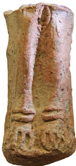
Fig. 4 : Figurine à vulve ouverte, Tall as-Sa'idiyah, S0326, XI e -X e siècle av. J.-C., terre cuite, H. 65 mm, British Museum London, 1987.0727.48

Dans les lignes 33 à 36 de KTU 1.13, une petite « bille » ( glgl ) est mentionnée. Elle est identifiée avec une « pierre d'amour » ( àbn rḥm ) qui, à l'évidence, occupe une fonction éminente dans l'exécution de la thérapie pour la guérison de la femme stérile. L'invocation suivante : « qu'une rafale issue de nuages orageux tourne la bille de pierre » ( rḥ ḥd' rpt gl[gl àbn] yhpk ) 37 , évoque une force naturelle ou surnaturelle censée de mettre cette « bille » en mouvement et stimuler la disponibilité de la femme à concevoir. Le vocabulaire ainsi que la syntaxe de cette partie de l'incantation sont incertains, et en raison de l'état corrompu de cette dernière partie de KTU 1.13, on n'apprend aucun détail supplémentaire sur cette « bille d'amour ». Néanmoins, le champ lexical du corps féminin, à travers des termes comme bīr « puits » et īrt pour désigner la vulve, les prédicats « fermée » et « habillée » exprimés au moyen des racines rtq et lbš , ainsi que le verbe « ouvrir » ( p' r ) auquel s'associe le vocabulaire évoquant l'acte sexuel – yd « pénis », le verbe « fortifier » ( àmr ) et les adjectifs rbb « grand » et šgr « petit » – tout