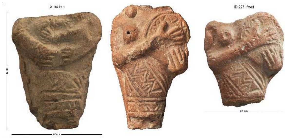
Fig. 3a : Figurine modifiée, Tall as-Sa'idiyah, terre cuite, 82 x 62 x 26 mm, Amman, Jordan Archaeological Museum Amman, J. 13786, © Department of Antiquities Amman via Franco-German Figurines Project (FGFP), photo : Thomas Graichen ; 3b : Figurine au tambourin, Tell el-Far'ah Nord, F3426, 101 x 63 x 36 mm, Musée Rockefeller Museum Jerusalem, published by courtesy of the Israel Antiquities Authority, photo : Yael YOLOVITCH ; 3c : Figurine au tambourin, Citadelle d'Amman, trouvé en 2004, 74 x 62 x 34 mm, Nuweijis Amman T540, © Department of Antiquities Amman via Franco-German Figurines Project (FGFP), photo : Thomas Graichen ; toutes les trois : terre cuite, X e -IX e siècle av. J.-C.

Du Tall as-Sa'idiyah , dans la vallée centrale du Jourdain, provient un torse (fig. 3a) estampé qui ressemble de manière frappante à une série de figurines féminines attestées à l'est et à l'ouest du Jourdain, faites du même moule 23 . Le fragment a été ramassé à la