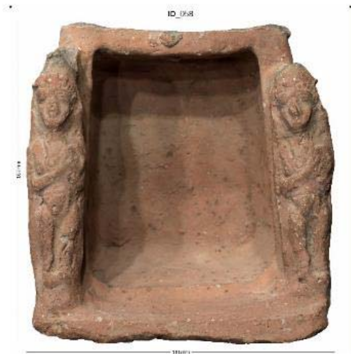
Fig. 6 : Figurines au tambour attachées à une maquette de sanctuaire, Karak (région), XI e -IX e siècle av. J.-C., terre cuite, 167 x 161 x 101 mm, Karak Archaeological Museum, J. 5751, © Department of Antiquities of Jordan, Amman via Franco-German Figurines Project (FGFP), photo : Thomas Graichen

devaient tenir lieu d'idiophones 41 appuyant le rythme du membra-<259>nophone. Ce jeu évoque une pratique d'incantation, plutôt qu'une simple musique – une pratique censée activer une puissance (divine) positive ou désactiver un effet (divin ou démoniaque) négatif. L'association au domaine du culte est suggérée encore par ce fait : depuis le X e siècle avant notre ère, le type de ces figurines, avec ou sans tambourin, n'est pas attesté seulement par des objets isolés, mais apparaît également sur des supports culturels, des autels et à l'entrée des maquettes de sanctuaire 42 .